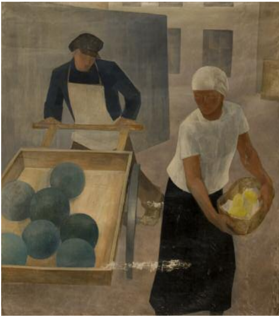
ЕВГЕНИЯ ВЛАДИМИРОВНА БЛАГОВЕЩЕНСКАЯ. 1899–1973 ПРОДАВЕЦ АРБУЗОВ. (УЛИЦА). 1925 Холст, масло. 158 × 141 см Дипломная работа. Мастерская К.С. Петрова-Водкина