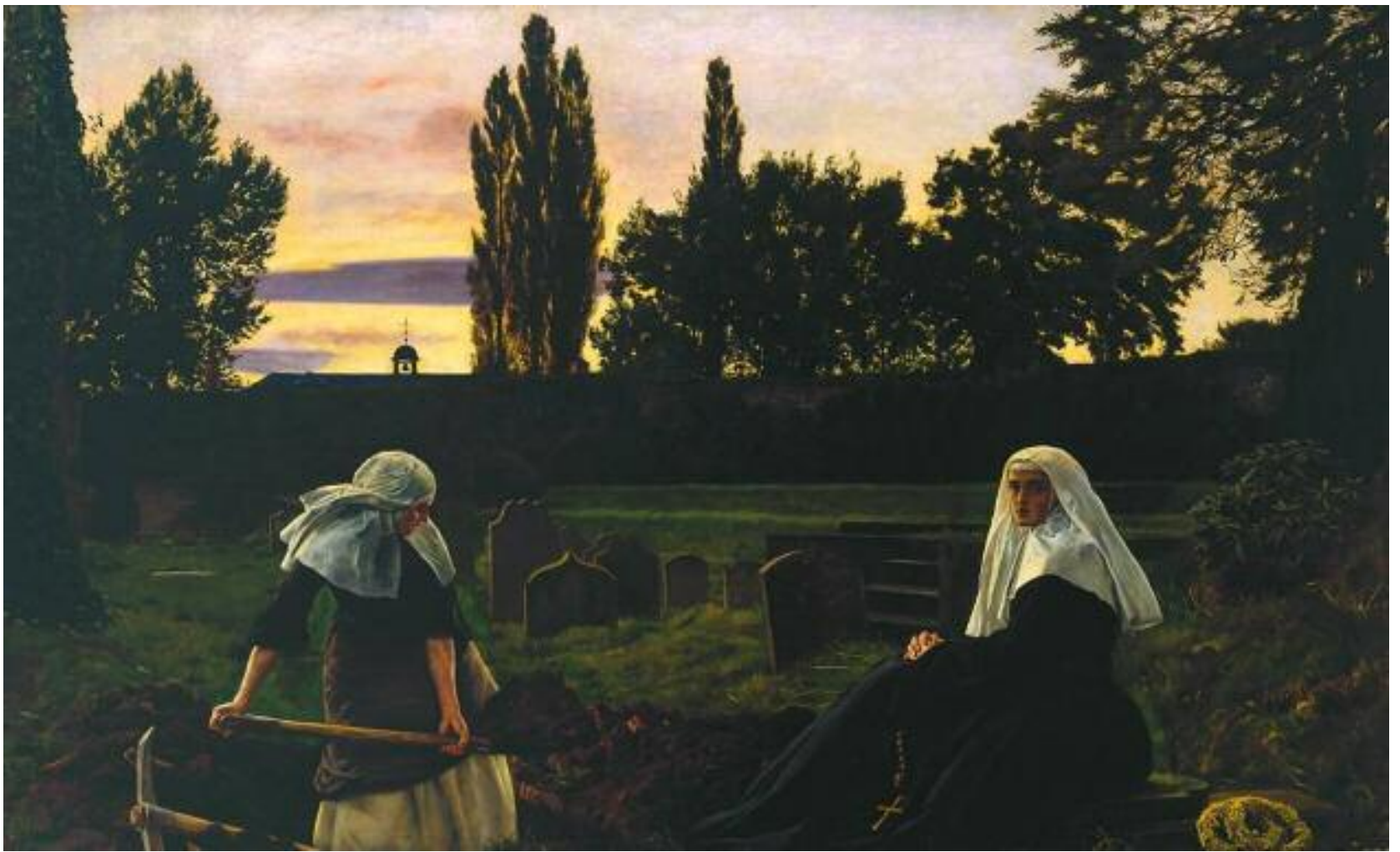
ДЖОН ЭВЕРЕТТ МИЛЛЕС ДОЛИНА ВЕЧНОГО ПОКОЯ («УСТАЛЫЙ ОБРЕТЕТ ПОКОЙ»), 1858 Холст, масло. 102,9 × 172,7 Галерея Тейт Бритен, Лондон