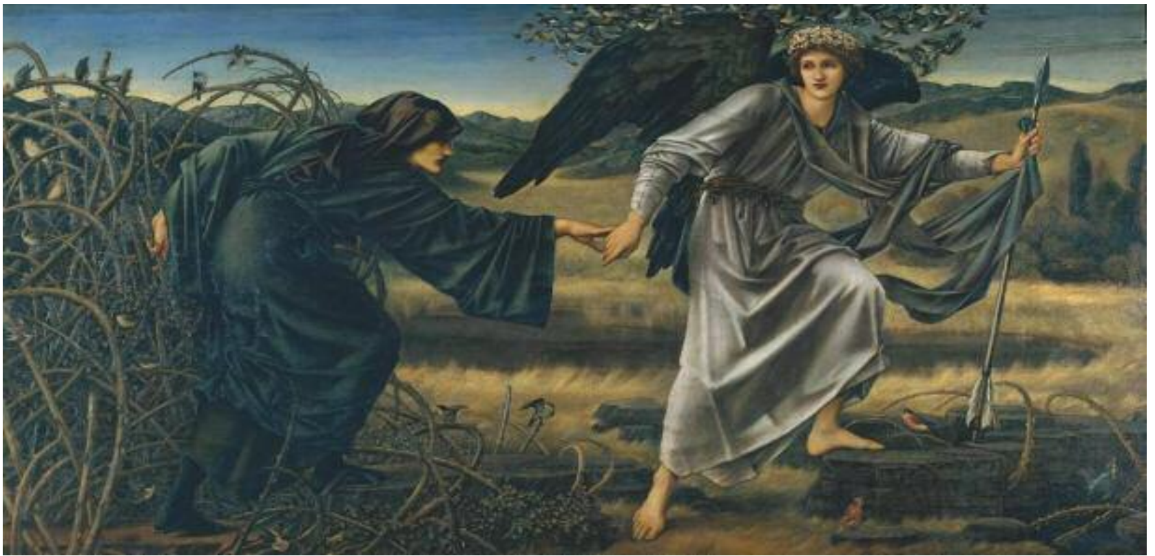
ЭДВАРД БЁРН-ДЖОНС ЛЮБОВЬ, ВЕДУЩАЯ ПИЛИГРИМА. 1896–1897

Холст, масло. 157,5 × 304,8 Галерея Тейт Бритен, Лондон