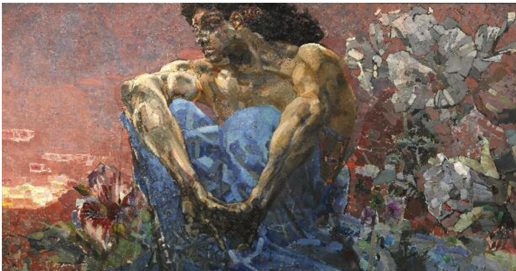
МИХАИЛ ВРУБЕЛЬ ДЕМОН (СИДЯЩИЙ). 1890 Холст, масло. 114 × 211 ГТГ