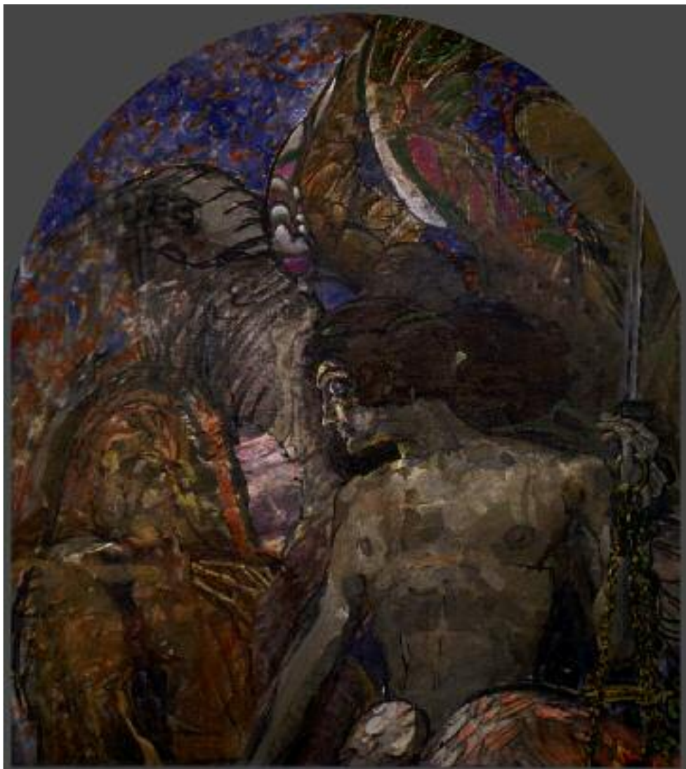
МИХАИЛ ВРУБЕЛЬ ПРОРОК. 1898 Холст, масло. 145 × 131 ГТГ