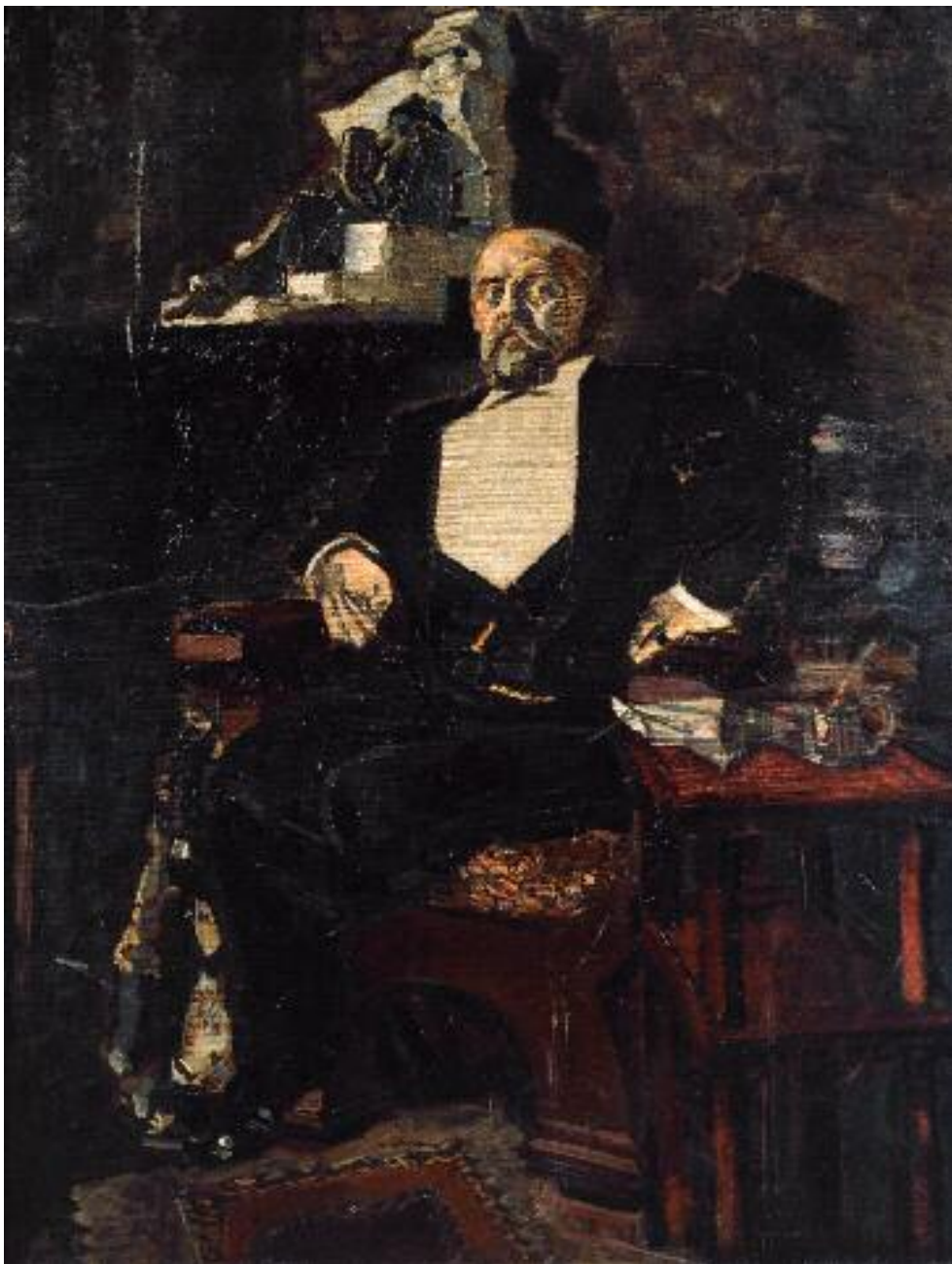
МИХАИЛ ВРУБЕЛЬ ПОРТРЕТ САВВЫ ИВАНОВИЧА МАМОНТОВА. 1897