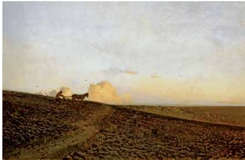
И.И.ЛЕВИТАН Вечер на пашне. 1883 Холст, масло 43,3 × 67 ГТГ

Isaac LEVITAN Evening on Tilled Soil. 1883 Oil on canvas 43.3 × 67 cm Tretyakov Gallery