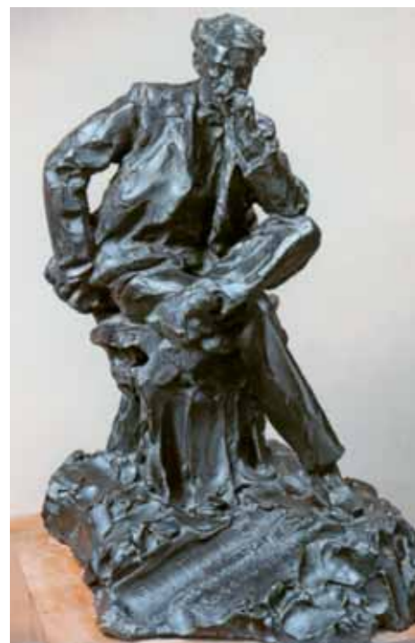
П.П.ТРУБЕЦКОЙ Портрет И.И.Левитана. 1899 Гипс тонированный 41 × 27 × 33 ГРМ

Léon BAKST ▶ Portrait of Isaac Levitan 1899 Lithograph