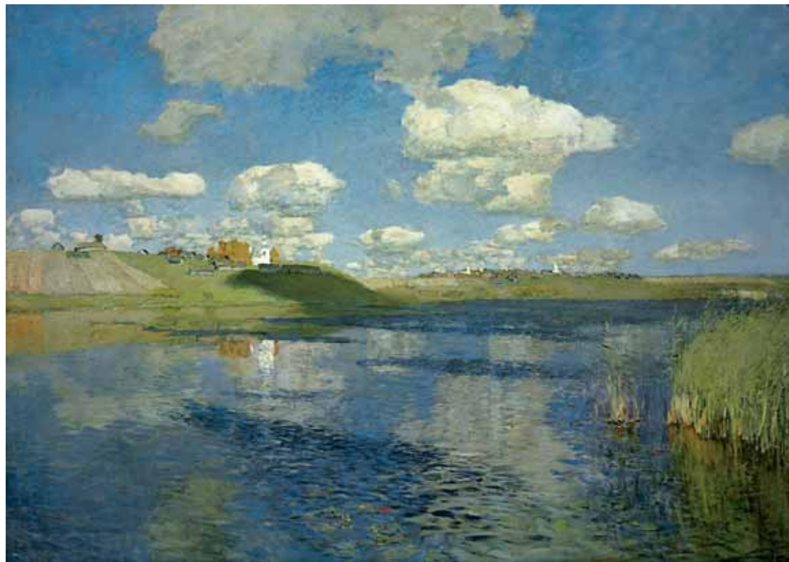
И.И.ЛЕВИТАН Озеро. 1899–1900 Холст, масло 149 × 208 ГРМ

Isaac LEVITAN Lake . 1899–1900 Oil on canvas 149 × 208 cm Russian Museum