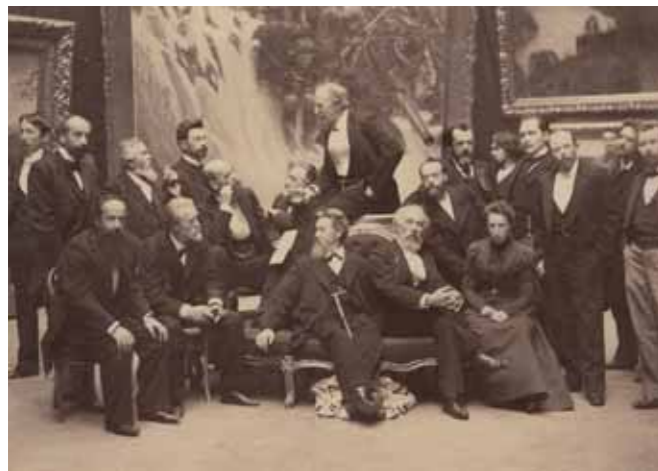
И.И.Левитан (стоит второй слева) в группе художников ТПХВ Фотография. 1899 ОР ГТГ

Isaac Levitan (standing second left) in a group of artists at MSAL. Photo. 1899 Department of manuscripts, Tretyakov Gallery