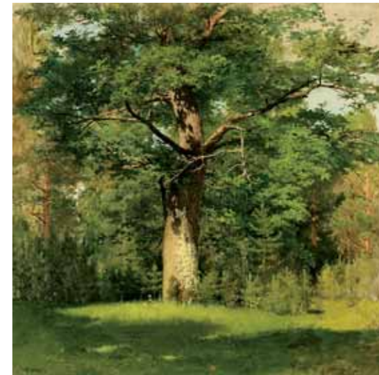
И.И.ЛЕВИТАН Аллея. Останкино Начало 1880-х Холст на картоне, масло 54,3 × 43,6 ГТГ

Isaac LEVITAN An Alley. Ostankino Early 1880s Oil on canvas mounted on cardboard. 54.3 × 43.6 cm Tretyakov Gallery