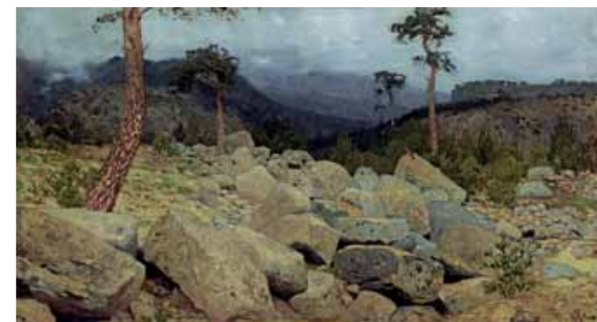
И.И.ЛЕВИТАН Крым. В горах. 1886 Неоконченный этюд Бумага на холсте, масло. 20 × 23,4 ГТГ

Isaac LEVITAN Oak Tree. 1880 Oil on canvas 57.5 × 57.6 cm Tretyakov Gallery