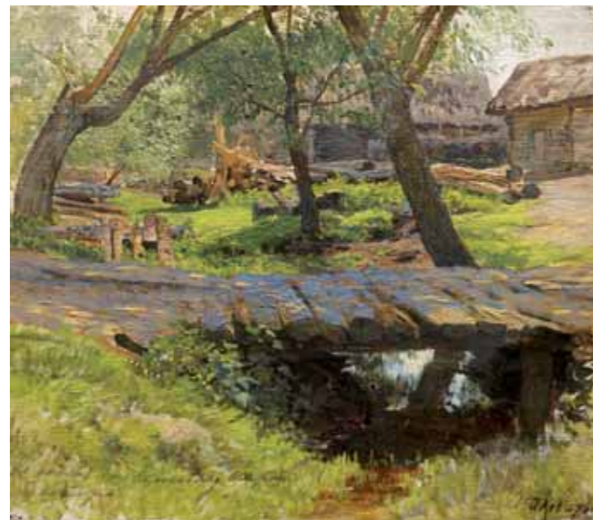
И.И.ЛЕВИТАН Мостик. Саввинская слобода. 1884 Этюд Холст, масло. 25 × 29 ГТГ

Isaac LEVITAN Little Bridge. Savvinskaya Township. 1884 Study Oil on canvas. 25 × 29 cm Tretyakov Gallery