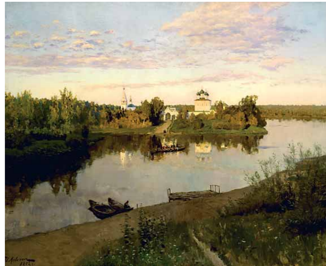
И.И.ЛЕВИТАН Вечерний звон. 1892 Холст, масло 87 × 107,6 ГТГ

Isaac LEVITAN Vesper Bell. 1892 Oil on canvas 87 × 107.6 cm Tretyakov Gallery