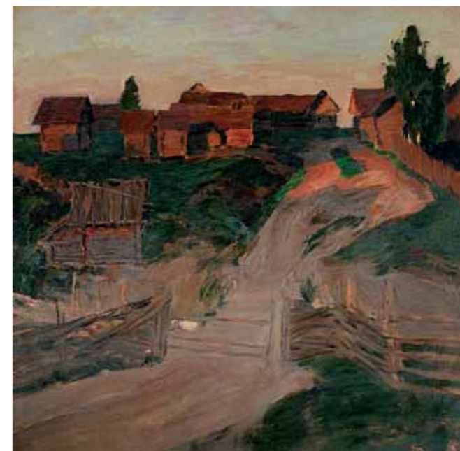
И.И.ЛЕВИТАН Весна – большая вода. 1897 Холст, масло 64,2 × 57,5 ГТГ

Isaac LEVITAN Spring Flood. 1897 Oil on canvas 64.2 × 57.5 cm Tretyakov Gallery