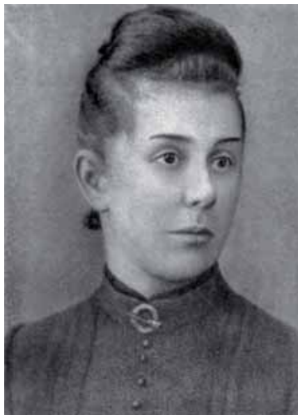
А.Н.Турчанинова Фотография Воспроизводится по изд.: Исаак Ильич Левитан. Документы, материалы, библиография. М., 1966

Isaac LEVITAN ▶ Autumn. Estate. (Autumn. Dacha). 1894 Pastel on paper 48 × 63 cm Vrubel Museum of Fine Arts, Omsk