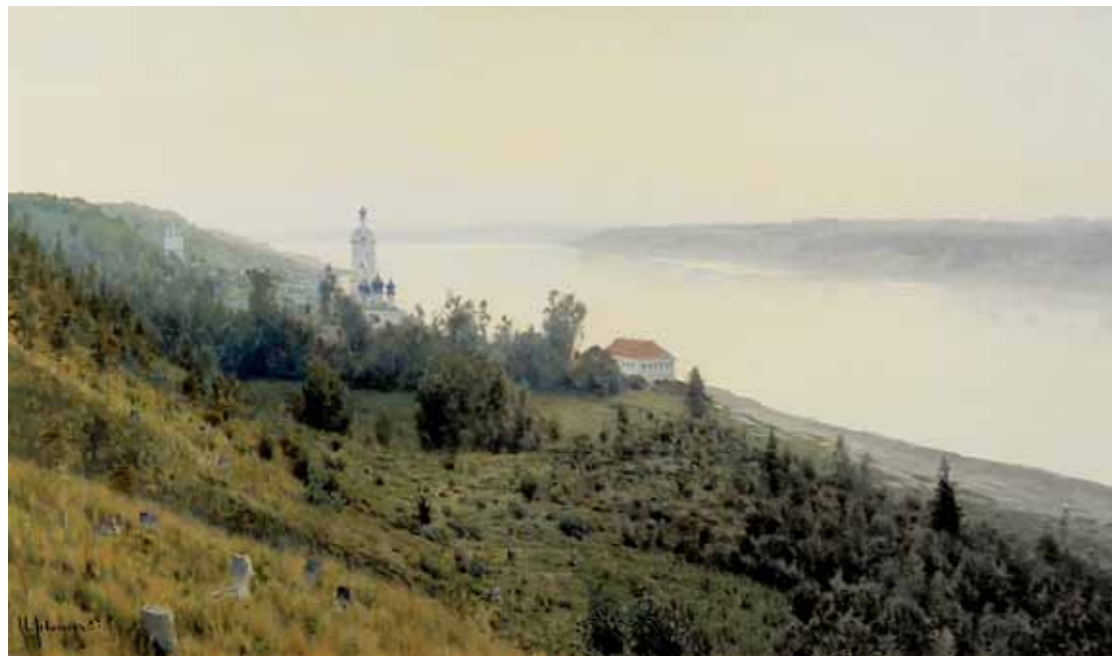
И.И.ЛЕВИТАН Вечер. Золотой Плѣс. 1889 Холст, масло 84,2 × 142 ГТГ

Isaac LEVITAN Evening. Golden Plyos. 1889 Oil on canvas 84.2 × 142 cm Tretyakov Gallery