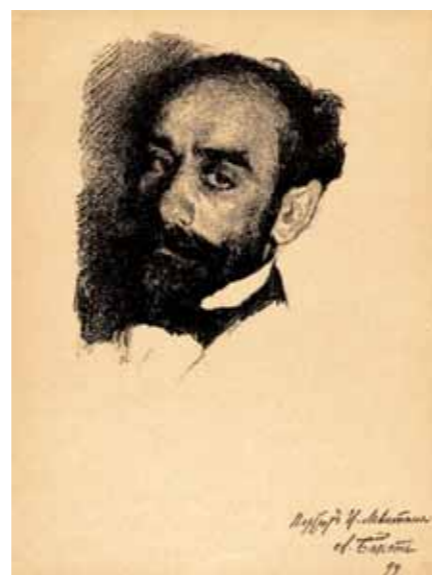
Л.С.БАКСТ ▶ Портрет И.И.Левитана 1899 Литография

Levitan left after his death about 40 unfinished paintings and 300 sketches. The monumental painting “Lake” (Russian Museum), on which Levitan worked in 1899–1900, remained unfinished. The artist’s last piece was “Hay-making” (Tretyakov Gallery).