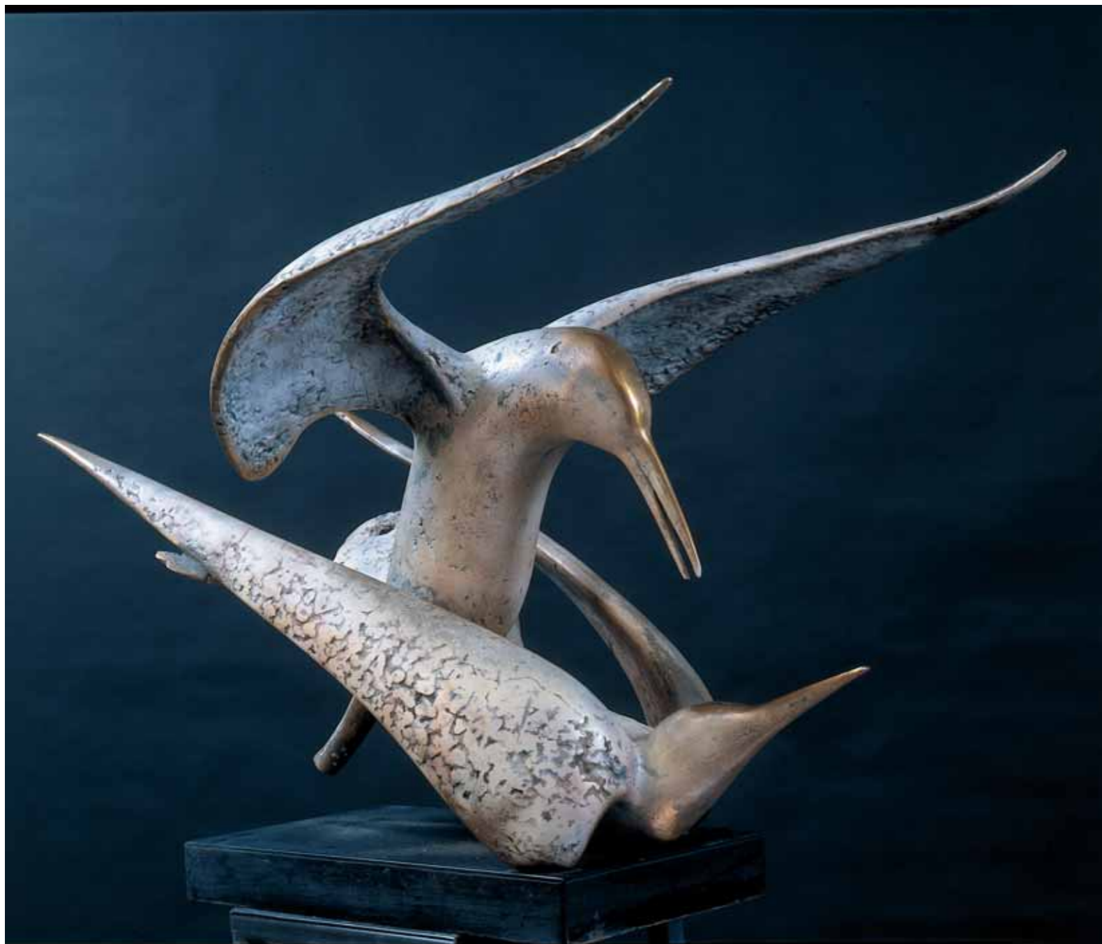
Чайки. 1998 Бронза 68 × 110 × 70