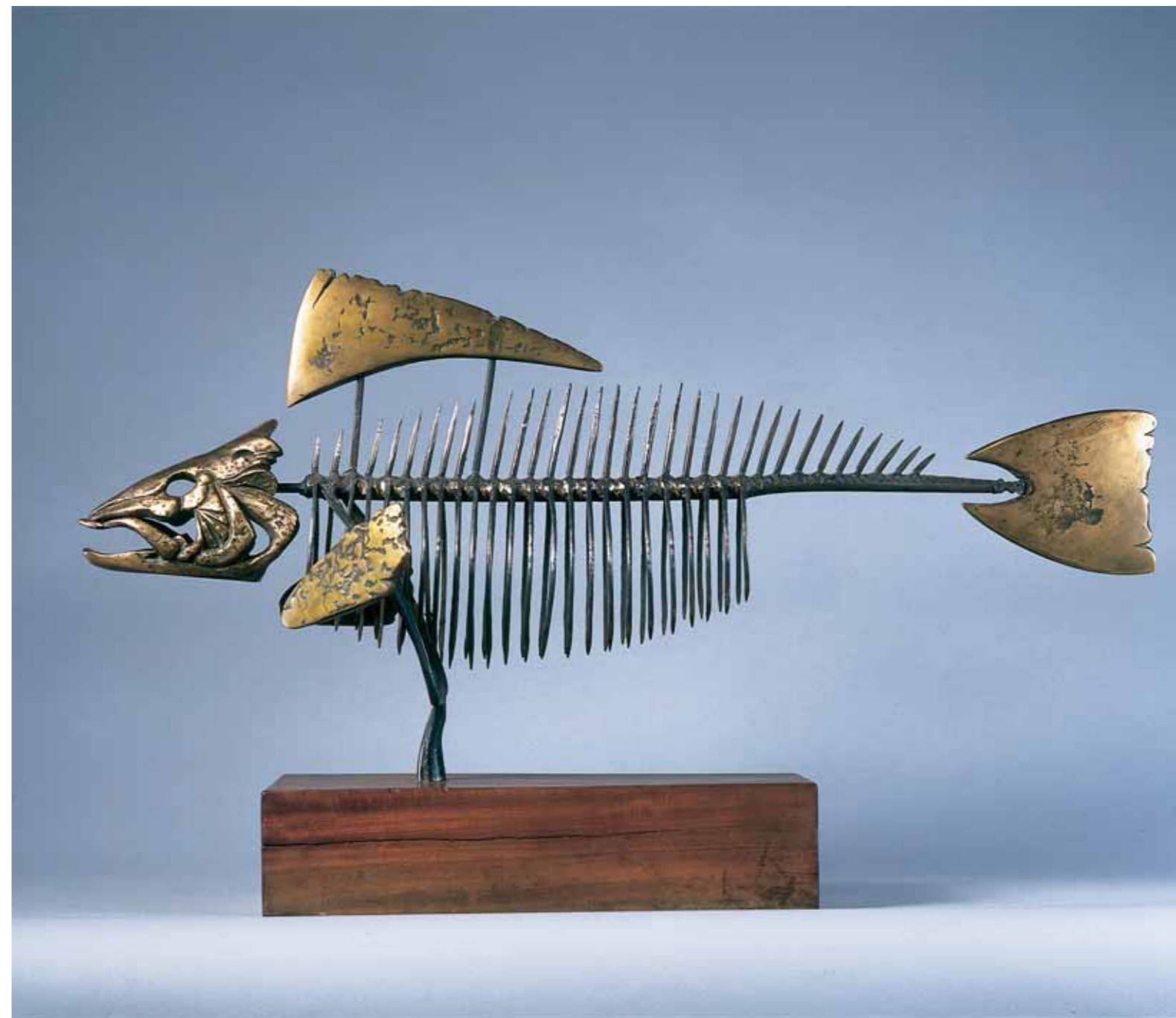
Скелет. 1988 Бронза 97 × 40 × 30

Because the degree of anthropomorphism of these creatures and their representational characteristics are emotionally certain and stylistically circumscribed, they perfectly match the size given them once and for all when they were cast in bronze. However, different from the above-mentioned works, such figures as “Golden Beetle”, “Chrystal Butterfly” or “Spider”, in spite of their superficial recognizability and definiteness, are intimate in terms of their narratives, and realistic quality; they epitomize different ideas, which transcend the limits of actual time and space of specific manifestations of fast-flowing life. And whereas, looking at the pieces such as “The Karate Salamander”, “A She-guest. Big Lemur” and “Jerboa”, we relish the brilliantly captured emotional aspects and admire the consummate materialization thereof in art, works such as “Golden Beetle”, “Chrystal Butterfly” or “Spider” provoke a different understanding of the