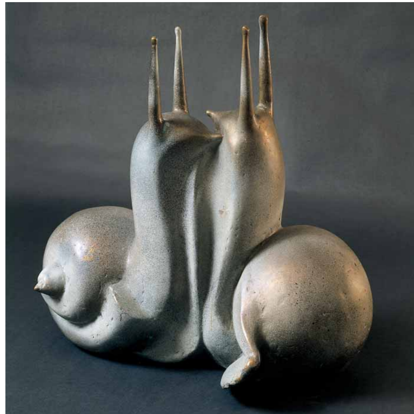
Snails. 1987 Bronze, 78 × 68 × 32 cm

эмоциональные ракурсы, восхищаемся их виртуозным воплощением, то здесь возникает другое, противоположное традиционному пониманию восприятие образа, в котором превалирует иррациональное начало отвлеченной от земной суеты формулы бытия, ее вселенский смысл, непознаваемая космическая энергетика. Предчувствие несвершившегося, устремленность в бесконечный простор иных миров, всепоглощающая тайна определяют особую образную драматургию, духовную значимость этих по сути своей монументальных произведений.