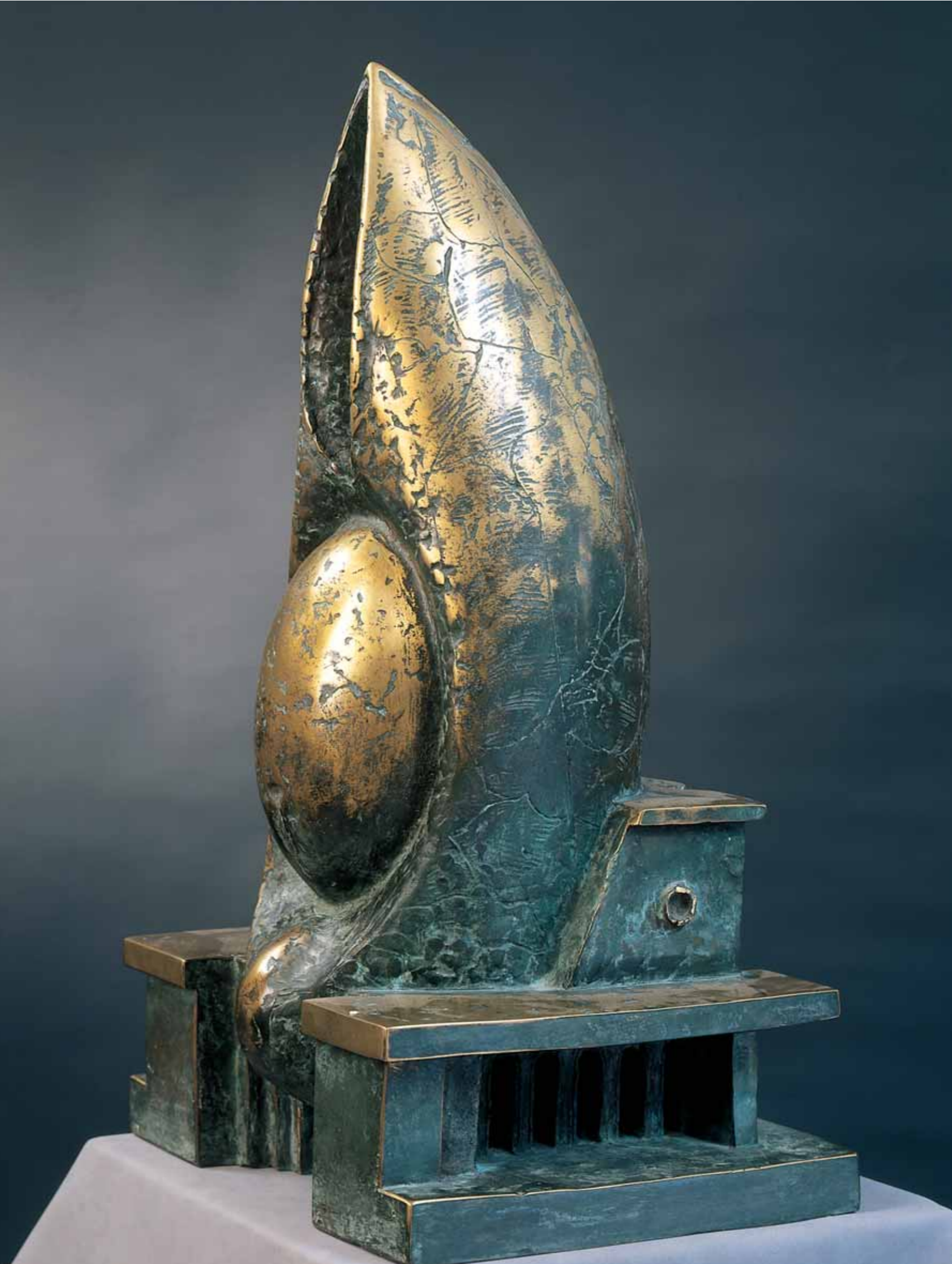
Temple. 1996 ▶ Bronze 100 × 65 × 68 cm