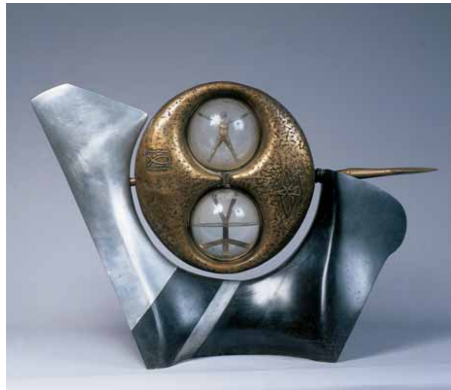
Храм. 1996 ▶ Бронза 100 × 65 × 68