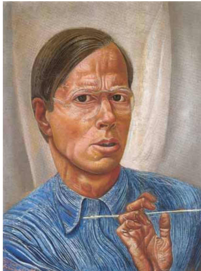
Б.Д.Григорьев Автопортрет Холст, масло. 61×46

On June 15 1995 at ten in the morning the bidding began. The room was full of new Russians and former Soviets, dealers and gallery owners, proprietors and collectors, and journalists. Although it was early in the day, even Galina Vishnevskaya came from Paris. She took a seat in first row, "arming herself with spectacles" and a "bidding paddle". It is hard to find words to describe the atmosphere at the bidding. The sale of Pyotr Vereshchagin's view of Nizhny Novgorod for a figure dozens of times more than the starting price became a sensation at the auction. There was a big hike in the price of Demidova's portrait by the end, too. According to the price list, the closing price reached £ 133,500 — more than $200,000! Alas, neither the Tretyakov Gallery nor other contenders — a group that included Russian banks — could guarantee that much money. Galina Vishnevskaya became the happy owner.