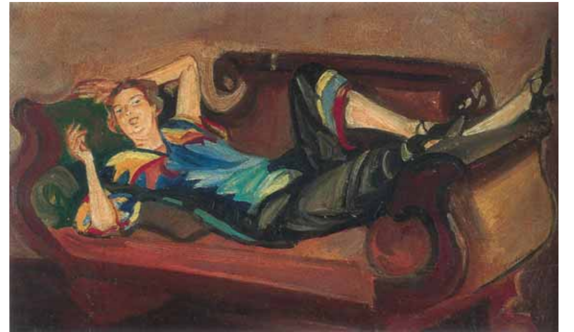
С.Ю.Судейкин На диване Холст, наклеенный на доску, масло 30×51,5