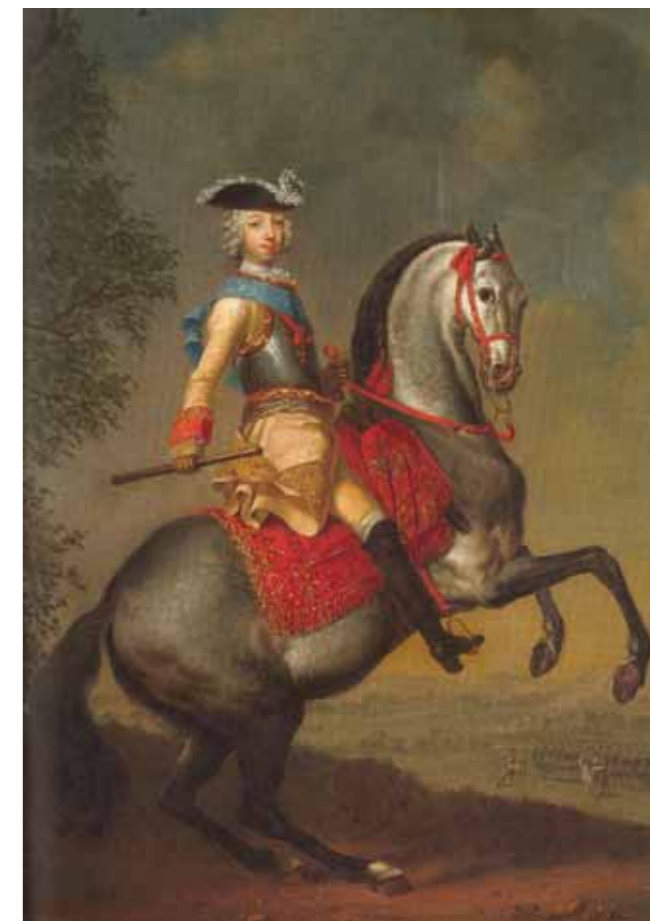
Георг Христоф ГроГ Конный портрет великого князя Петра Федоровича Холст, масло. 66×56

So I had to visit the archive of the Grabar Artwork Restoration Centre. An experienced archivist glanced at the registration card and said dryly that the piece in question was ascribed to Karl Briullov. How was that? I took a close look at the restoration documents, and