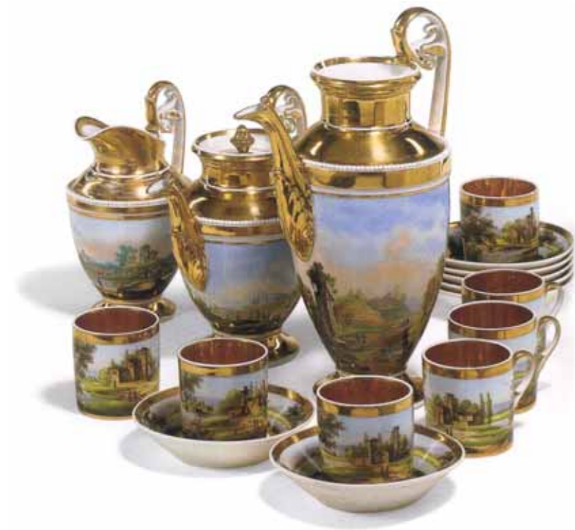
Часть фарфорового кофейного сервиза Конец XVIII века Высота кофейника 27 Гарднеровская мануфактура

A part porcelain coffee service Late 18th century Height of coffee pot 27 cm Gardner manufactory