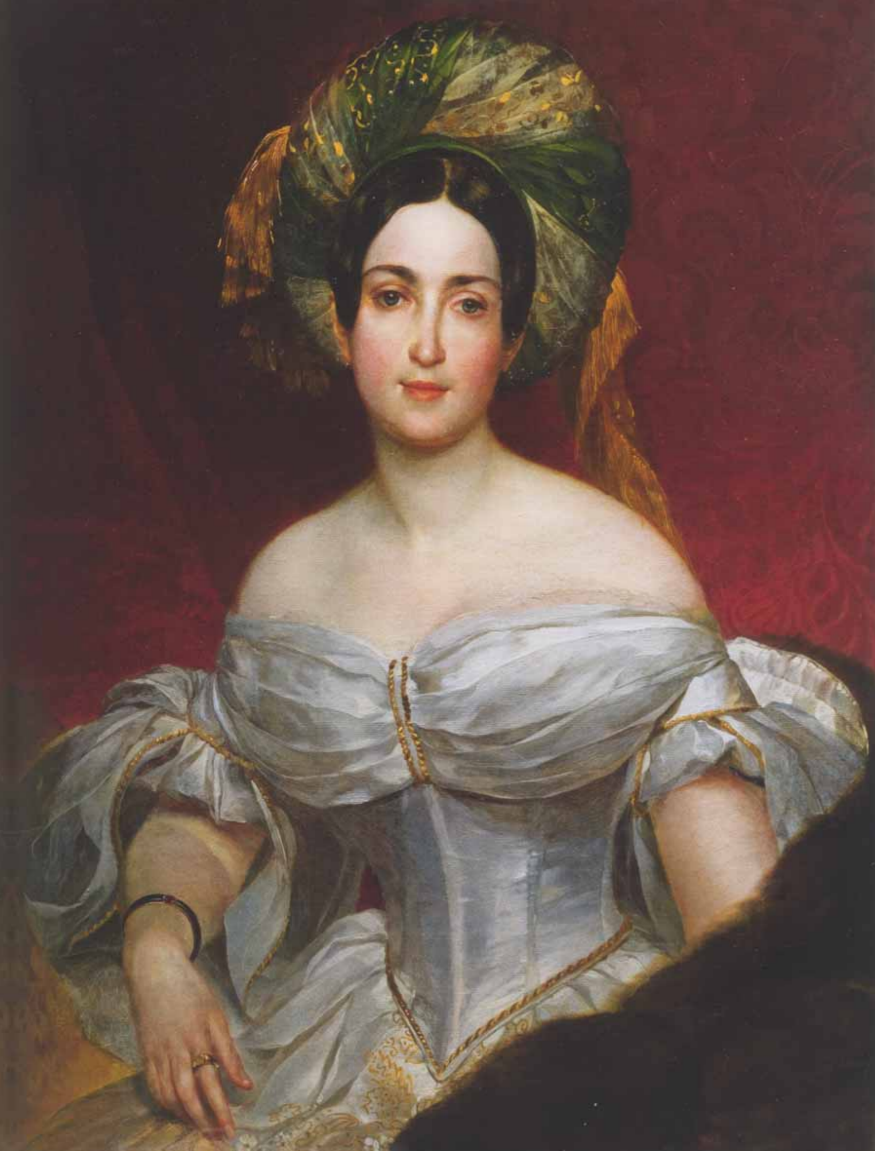
К.П.Брюллов Портрет княгини Авроры Демидовой Холст, масло. 90×71