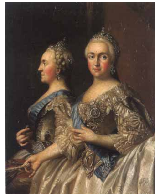
After Vigilius ERIKSEN Portrait of Catherine II Oil on board 34 by 27 cm