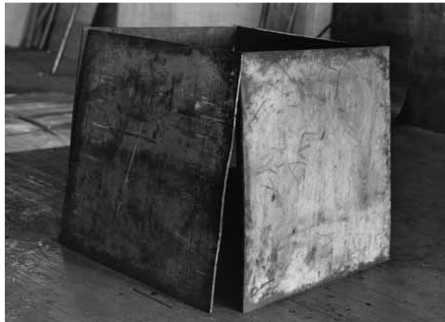
One Ton Prop (House of Cards). 1969 (refabricated 1986) Lead antimony, four plates, each 122 by 122 by 2.5 cm Gift of the Grinstein Family. © 2007 Richard Serra / Artists Rights Society (ARS), New York

first major steel pieces by Serra, "Circuit II" (1972–86), now in the collection of The Museum of Modern Art, consists of hot-rolled steel plates emerging from four corners of a room, providing an immersive environment as the viewer travels between the changing spaces established by the work. The equally bold "Delineator" (1974–75) comprises a large plate of hot-rolled steel installed on the ceiling and an equal-size plate on the floor, creating dialogues between ceiling and floor, and viewer and site.