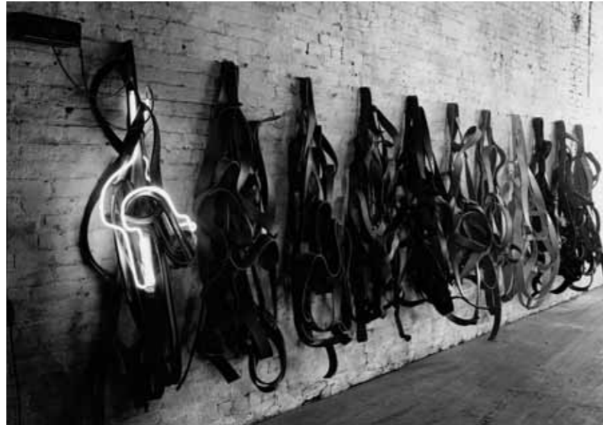
Belts. 1966-1967 Vulcanized rubber and neon tubing. 182.8 cm by 7.6 m by 50.8 cm Solomon R. Guggenheim Museum, N.Y. Panza collection