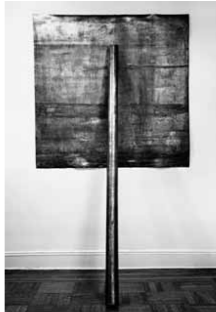
Подпорка. 1968 Свинец Пластина: 152,4 × 152,4 × 0,3 см; шест длиной 2,4 м Музей американского искусства Уитни, Нью-Йорк. Дар Фонда Говарда и Джин Липман