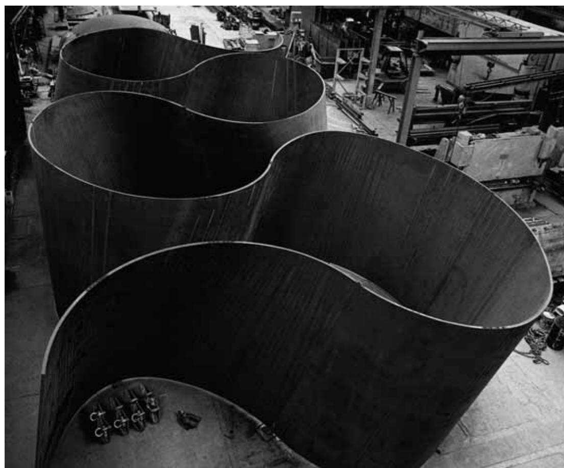
Лента. 2006 Сталь Габаритные размеры: 3,9 × 11,1 × 21,9 м; пластина толщиной 5,1 см Музей искусств округа Лос-Анджелес. Дар Эли и Эдит Брод