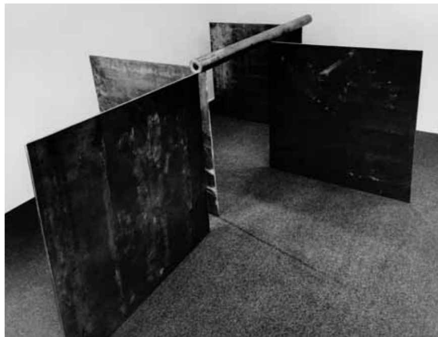
1 - 1 - 1 - 1. 1969 Свинец Четыре пластины: 121,9 × 121,9 см каждая; шест длиной 2,1 м Коллекция земли Северный Рейн-Вестфалия, Дюссельдорф