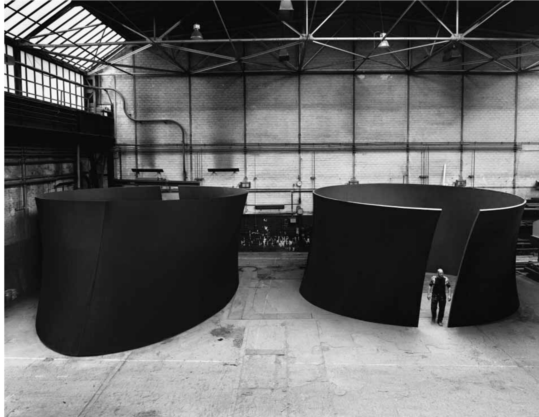
Torqued Torus ▶ Inversion. 2006 Weatherproof steel Two torqued toruses, each overall: 3.9 by 11 by 17.9 m; plate: 5.1 cm thick Collection of the artist

contact with Robert Rauschenberg, Ad Reinhardt and Frank Stella, later in New York with Carl Andre, Walter De Maria, Eva Hesse, Sol LeWitt, and Robert Smithson. He has received a number of very prestigious national and international awards. The sculptor seems to be working non-stop, commissioning new steel masterpieces to be melted and tempered at steel mills.