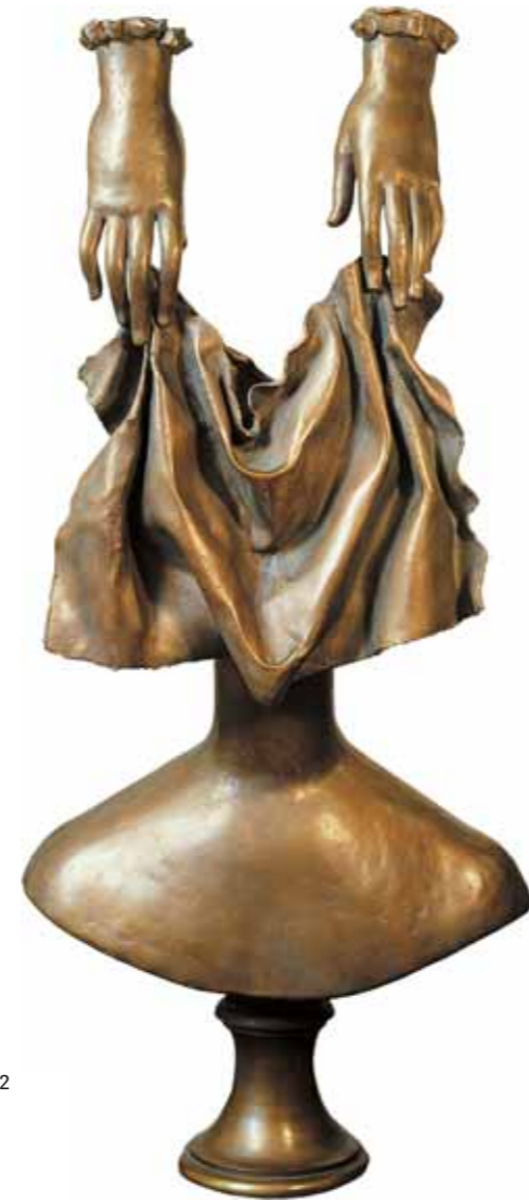
Занавеска. 1982 Бронза