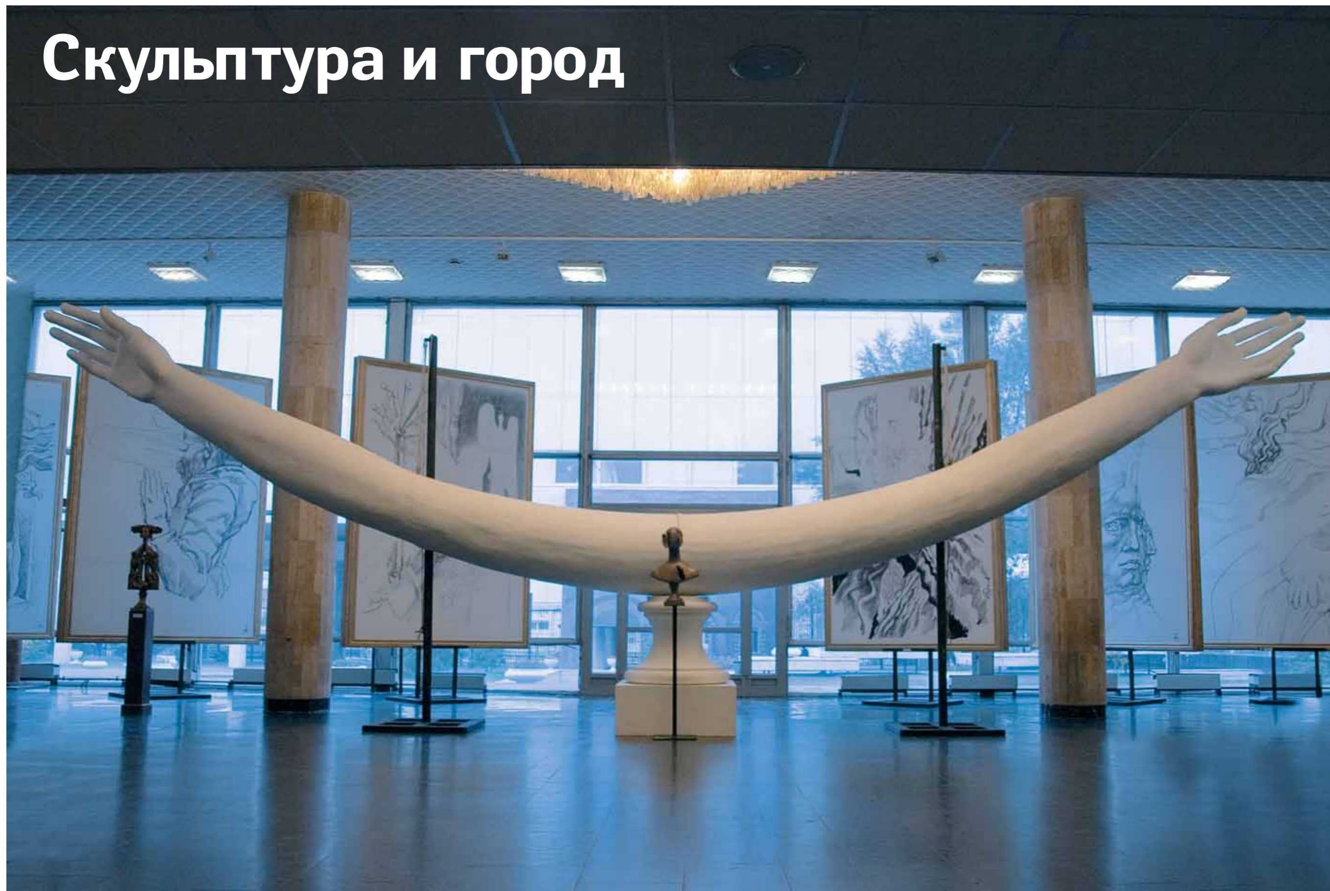
Руки. 2006 Гипс, металл