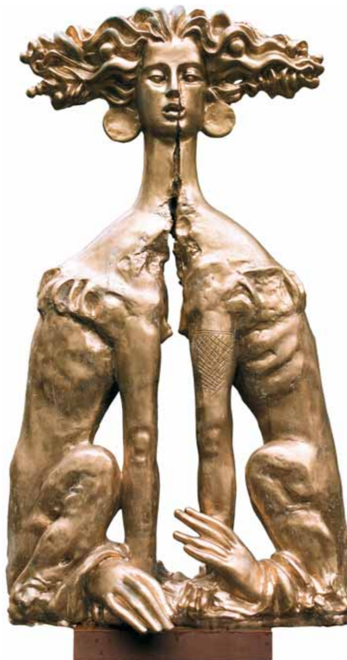
Сфинкс . 2001 Бронза

Today, visitors to the Tretyakov Gallery in Moscow's historic Lavrushinsky Pereulok can also admire an open air exhibition of Alexander Burganov's sculpture. An important event in the cultural life of the capital, this initiative forms part of a larger joint project between the State Tretyakov Gallery and the "Burganovs House" Moscow State Museum. Dedicated to the 150th anniversary of the Tretyakov Gallery, the project likewise includes a special exhibition in the Tretyakov Gallery on Krimsky Val.