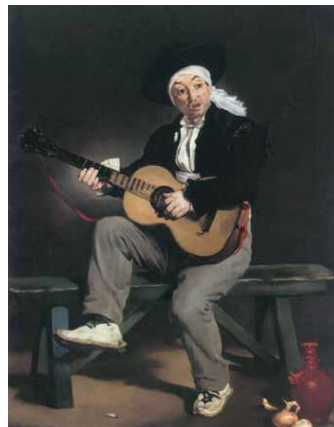
Edouard MANET ▶ The Spanish Singer. 1860 Oil on canvas 147.3 by 114.3 cm