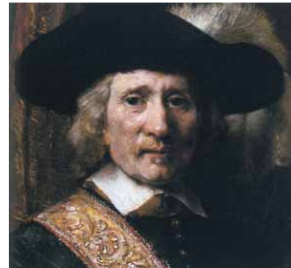
РЕМБРАНДТ Харменс ван Рейн Знаменосец (Флорис Сооп). 1654 Холст, масло 140,3×114,9 Фрагмент

Российским любителям французской живописи, посетившим выставку «Шедевры Музея Орсе» в Третьяковской галерее и обратившим внимание на удивительное полотно Ж.-Ф.Милле «Весна», будет интересно узнать, что другая картина этого художника из цикла «Времена года» – «Стога: осень» (ок. 1874) – сейчас экспонируется в Мартини. Пейзаж изображает равнину Шайи: в центре возвышаются монументальные стога – жатва закончена, поле безлюдно, на нем мирно пасутся овцы, вдалеке видны крыши Барбизона. Как и в «Весне», в этой картине художник мастерски изображает грозное небо. «Осень» была представлена на ретроспективной выставке Милле в Париже в 1887 году, где ее увидели и Клод Моне, затем воплотивший в живописи собственные, вошедшие в историю мирового искусства «Стога», и Ван Гог, сохранивший восхищение работами мастера на всю жизнь. В Мартини показана его работа «Первые шаги (по Милле)». Ван Гог часто копировал