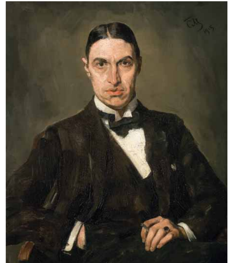
Vasily POLENOV Rabbi Gillel . A study for the painting "Among the Teachers" 1896 Oil on canvas mounted on cardboard 71.5 by 50.5 cm

лектуальную самоуглубленность модели. Именно на таком выразительном портрете, созданном художником в 1915 году, изображен Георгий Иванович Иванов. Он был незаурядным поэтом. Малютин воплотил в этом образе яркую личность своей эпохи, продолжив тем самым портретную галерею «лучших людей нации», которую задумал и собирал еще П.М.Третьяков.