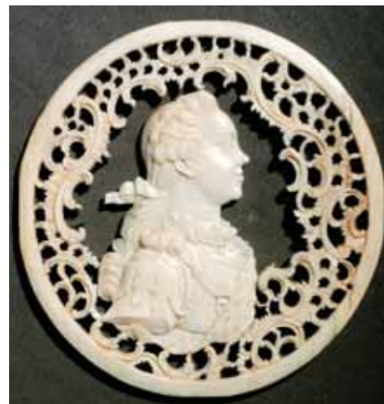
Unknown artist. Russia Portrait of Great Prince Pavel Petrovich 2nd half of the 18th century Carved ivory, 8 by 7.5 cm