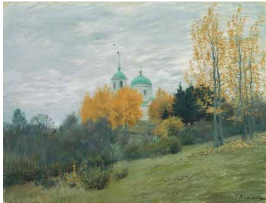
И.И. ЛЕВИТАН Осенний пейзаж с церковью . 1890 Бумага, пастель 62×47