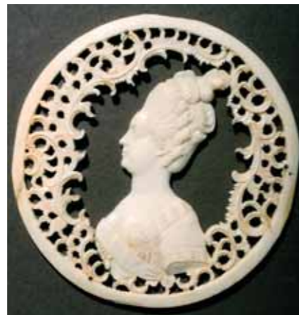
Неизвестный мастер. Россия Портрет Великой княгини Марии Федоровны 2-я половина XVIII в. Слоновая кость, резьба 8×7,5