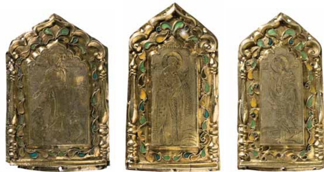
Дробница «Спас Смоленский». Конец XIX в. Россия. Чеканка, гравировка, литье, цв. эмаль по скани. 10×6,6

На антикварном рынке в последние годы не встречается произведений выдающегося русского скульптора, в творчестве которого отразились почти