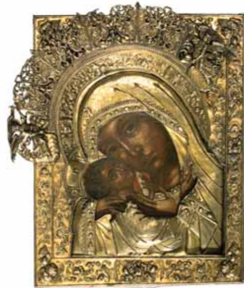
Икона «Богоматерь Корсунская». XVII–XVIII вв. Россия. Дерево, темпера. 43,5×33,5

Освещение комплектования музейной коллекции на основе индивидуальных пожертвований и государственной закупочной политики было начато в первом номере журнала за 2005 год. Продолжить ее, продемонстрировав, какими первоклассными произведениями пополнилось собрание галереи, – задача настоящей публикации. Мы упомянем приобретения последних пяти лет, среди которых произведения древнерусского искусства, полотна и рисунки старых мастеров, архивные материалы, декоративно-прикладные предметы, работы современных скульпторов, живописцев и графиков.