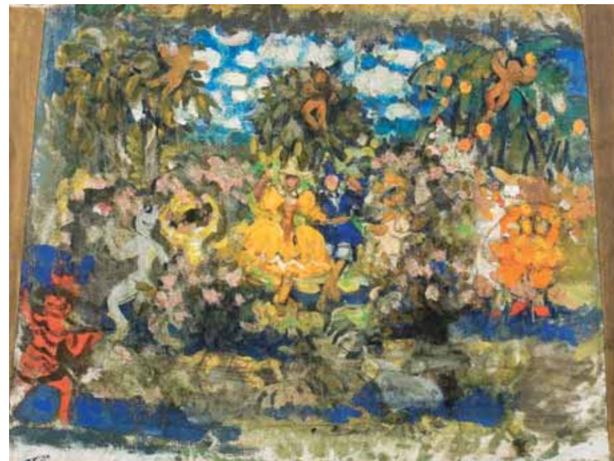
Н.Н. САПУНОВ Голландка Лиза . 1910 Холст, темпера. 55×74 На сюжет пасторали М.А.Кузмина, поставленной Вс.Э.Мейерхольдом