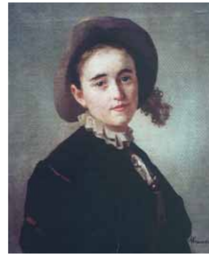
И.Н. КРАМСКОЙ Портрет девочки в фетровой шляпе . 1883 Холст, масло. 60×49

Finally, at the end of 2004 the Federal Agency for Culture and Cinematography bought for the Tretyakov Gallery the "Portrait of Poet Georgy Ivanov" by Sergei Malyutin. Like many of his time, Malyutin was a universal artist – painting, designing theatre sets, drawing and also working as a book illustrator, applied artist and architect. As a portraitist, he evolved from the free-spirited, dynamic art of the