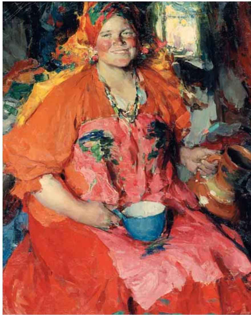
А.Е.АРХИПОВ Девушка с кувшином 1927 Холст, масло 108×67