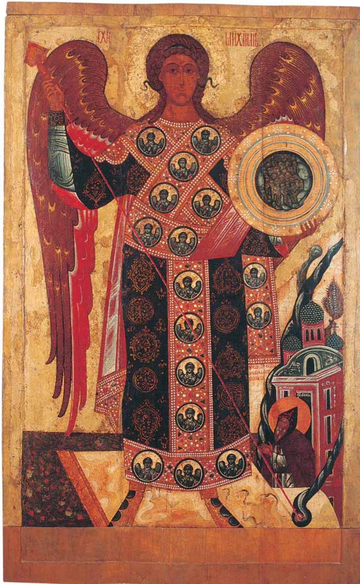
Архангел Михаил с чудом в Хонех Конец XV – начало XVI века Дерево, темпера 159×98 Рязанский государственный областной художественный музей имени И.П. Пожалос- тина