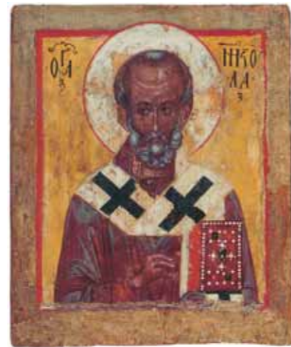
Святитель Николай Чудотворец Конец XIV – начало XV века Оборот выносной (запрестольной) двусторонней иконы «Богоматерь Петровская» первой половины XVI века Дерево, темпера 46,5×39 Череповецкое музейное объединение St Nicholas the Miracle-Worker Late 14th – early 15th century Reverse of the double-sided portable altarpiece icon "Petrovskaya Mother of God". First half of the 16th century Tempera on wood 46.5 by 39 cm Cherepovets Museum Amalgamation

И дея выставки возникла благодаря успеху и неослабевающему общественному интересу к проекту «Золотая карта России», инициированному и реализуемому Третьяковской галереей с 1999 года. В 2004 году он был удостоен Государственной премии Российской Федерации в области литературы и искусства. Члены авторского коллектива при содействии Фонда поддержки российских музеев «Сокровища Отечества» разрабатывали различные варианты экспозиции, призванной показать развитие русского искусства в системе двух координат: по мощной вертикали – хронологически и по широкой горизонтали – представляя географическую протяженность музейной сети России, которая вмещает и олицетворяет важнейшую составляющую понятия национального культурного достояния страны. Таким образом, замысел панорамного показа отечественного искусства в выставочном формате обсуждался в стенах Галереи задолго до осуществления экспортного варианта – «блокбастера» «РОССИЯ!» в музеях Гуггенхайма в Нью-Йорке и Бильбао. «Золотая карта России», по сути, была воспринята и оценена музейным сообществом России, публикой и государством как важный национальный проект в области культуры, заслуживающий поддержки и продолжения. Этим объясняется живой отклик наших партнеров и фигурантов проекта на предложение принять участие в масштабной юбилейной выставке и предоставить лучшие, знаковые