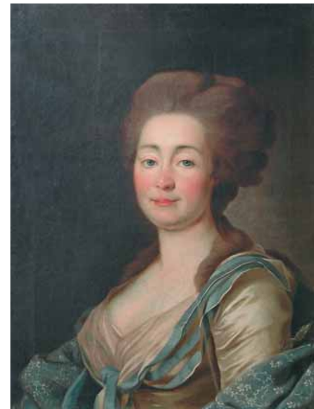
Д.Г.ЛЕВИЦКИЙ Портрет Доротеи Шмидт. Начало 1780-х Холст, масло. 66,5×50,5 Нижегородский государственный художественный музей

Искусство второй половины XIX века справедливо и неразрывно связано в нашем сознании с именем Павла Михайловича Третьякова, с сердцем и душой классической части собрания Третьяковской галереи. Для выставки подбирались произведения любимых и ценных Третьяковым художников – Василия Перова, Ивана Крамского, Ильи Репина, Исаака Левитана, Валентина Серова и других. Портрет писателя А.Ф.Писемского (1869) кисти Перова был приобретен знаменитым собирателем лично, после смерти литератора. В советское время, в 1930 году, работа передана в собрание нынешнего Ивановского объединения художественных музеев. «Портрет неизвестной» (1881, Курская государственная картинная галерея им. А.А.Дейнеки) исполнен Крамским в период его рефлексии на академическую салонную живопись, пользовавшуюся огромной популярностью у публики. Шедевр Репина «Нищая (Девочка рыбачка)» (1874, Иркутский областной художественный музей им. В.П.Сукачева) по соединению технических качеств и идеологической корректности можно считать знаковой и безупречной работой лидера движения зрелого передвижничества. Живо-