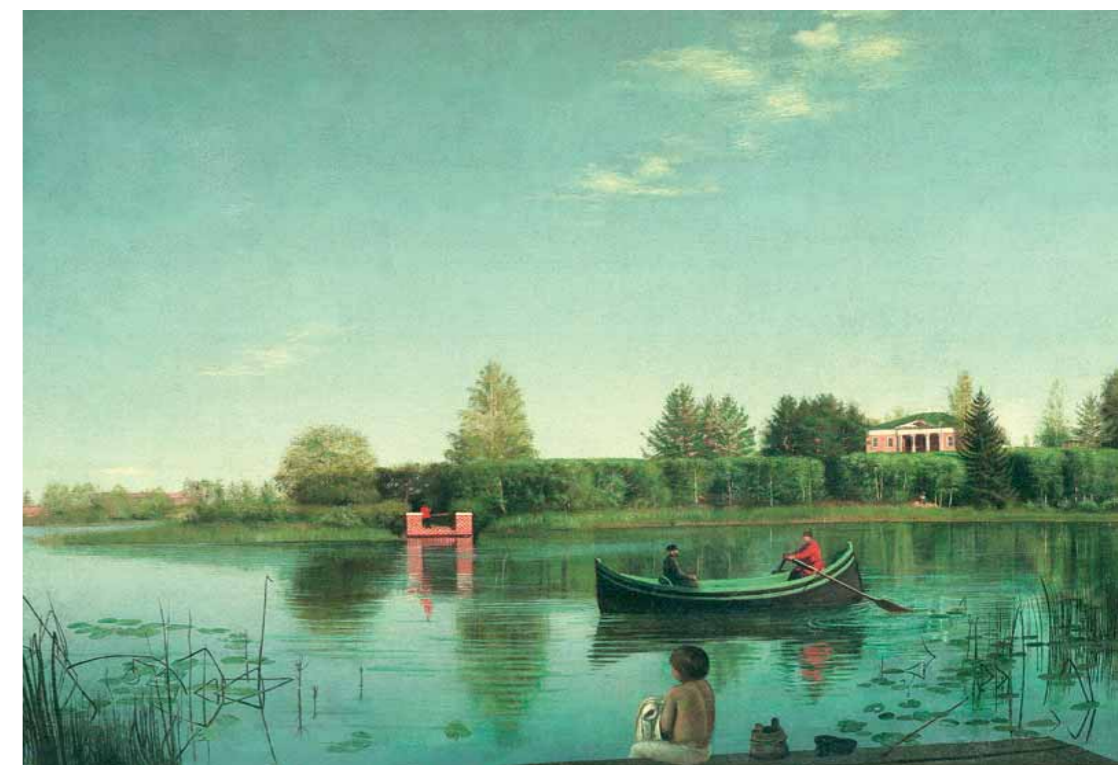
Grigory SOROKA A View of the Ostrovki Estate from the Great Island. 1846 Oil on canvas 72.4 by 97.5 cm Tver Regional Art Gallery