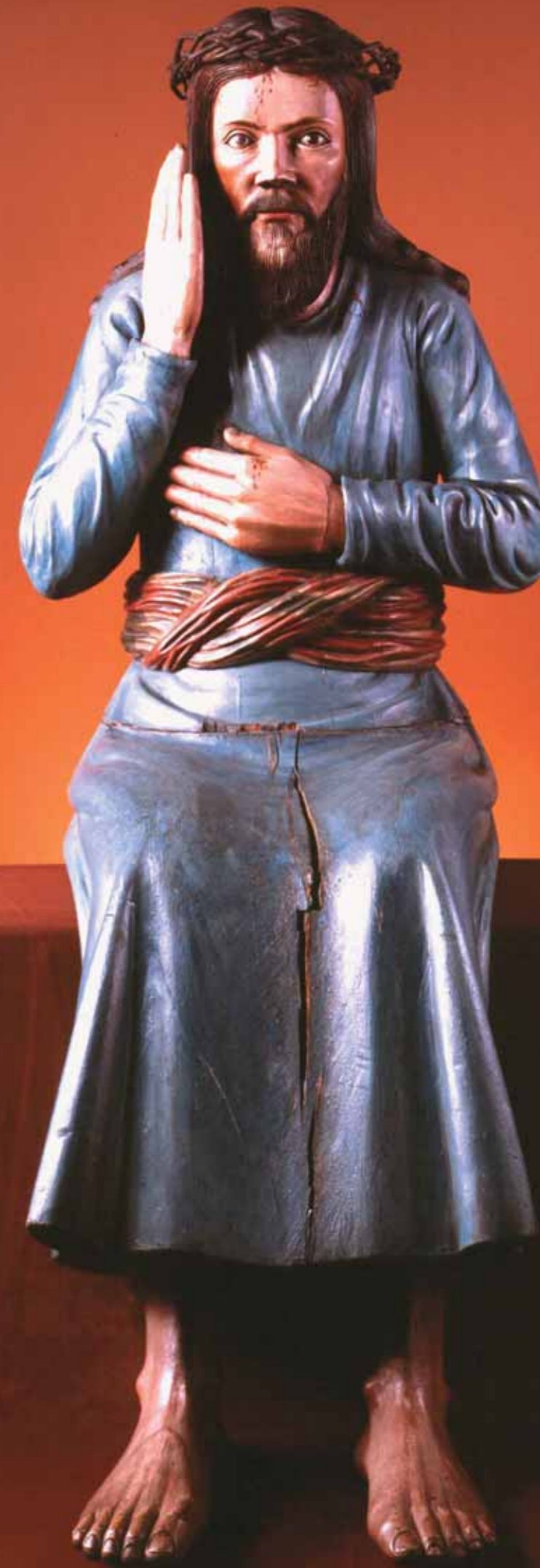
Христос в темнице Конец XVIII века Дерево, темпера 132х 55х57 Пермская государственная художественная галерея Christ in Prison Late 18th century Tempera on wood 132 by 55 by 57 cm Perm State Art Gallery