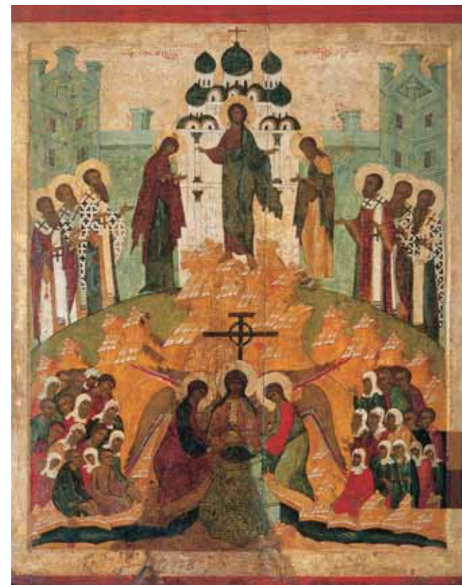
Происхождение честных древ Животворящего Креста Господня 1510–1520-е Дерево, темпера 108×87 Государственный Владимиро-Суздальский историко-архитектурный и художественный музей-заповедник The Origin of the True Tree of the Life-Giving Cross of the Lord 1510–1520s Tempera on wood 108 by 87 cm Vladimir-Suzdal State Historical Architecture and Art Museum-Reserve

Экспозиция, которую составляют свыше ста произведений отечественного искусства XIV – первой половины XX века из собраний тридцати музеев России, построена по хронологическому принципу. В аннотациях содержится интересная информация о каждом произведении. Экспликации посвящены краткой истории музеев-участников, их связям с Третьяковской галереей. Специально отмечены произведения, приобретенные Павлом Михайловичем Третьяковым и(или) впоследствии переданные из Государственной Третьяковской галереи в собрания региональных музеев, в их числе работы Д.Левитского, Сильв. Щедрина, Ф.Моллера, В.Перова, И.Левитана и др.