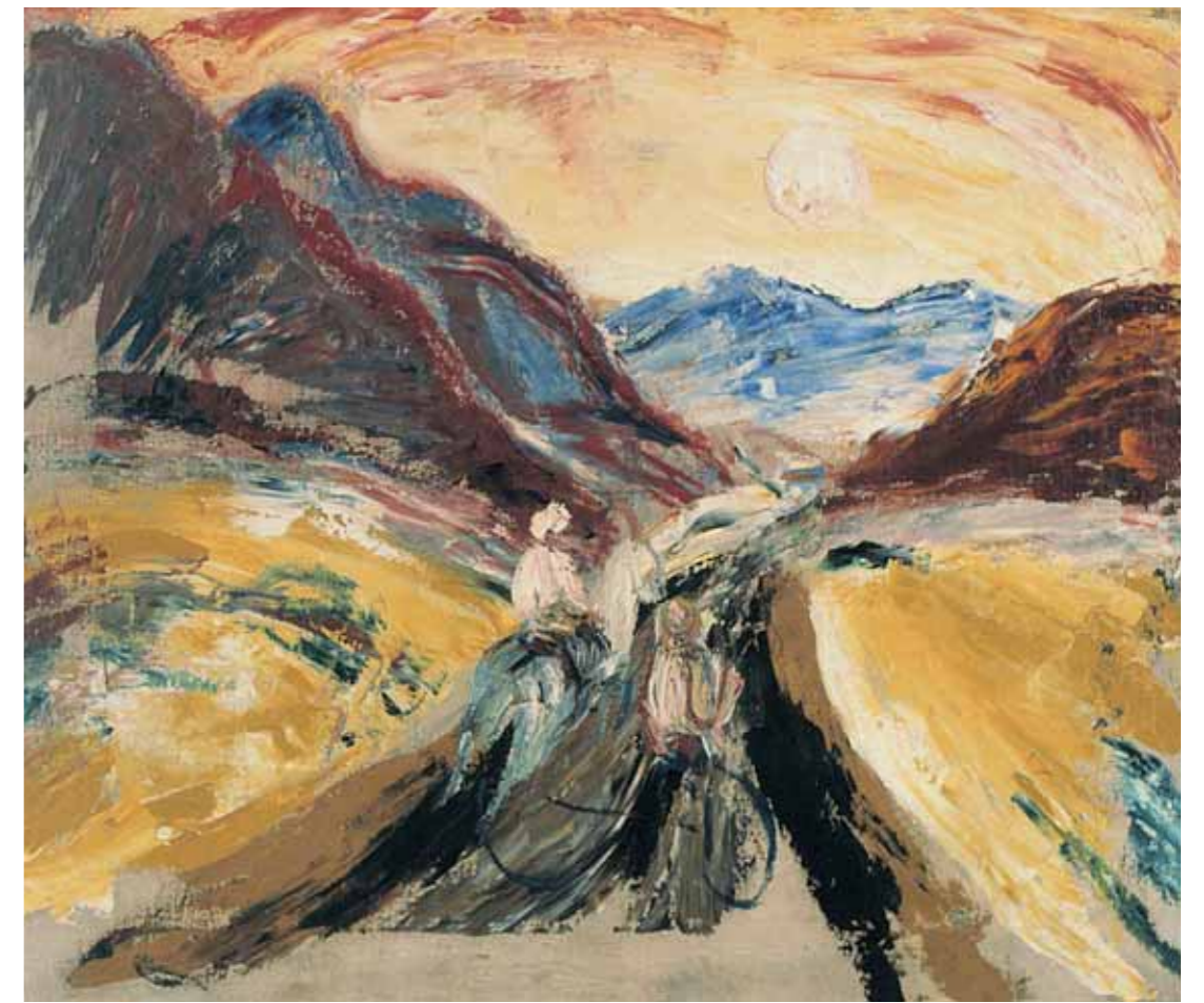
А.Д.ДРЕВИН Долина реки Чарыш 1930 Холст, масло. 59×70 Государственный музей Алтайского края, Барнаул

The Tretyakov Gallery thanks its partners, the regional administrations and the Golitsyn family, as well as the restoration experts, museum curators, photographers, show designers, and those who rendered financial support to this project. Special thanks are due to the Federal Agency for Culture and Cinematography, whose support was vital for the realization of this huge project and the publication of a catalogue in Russian and English.