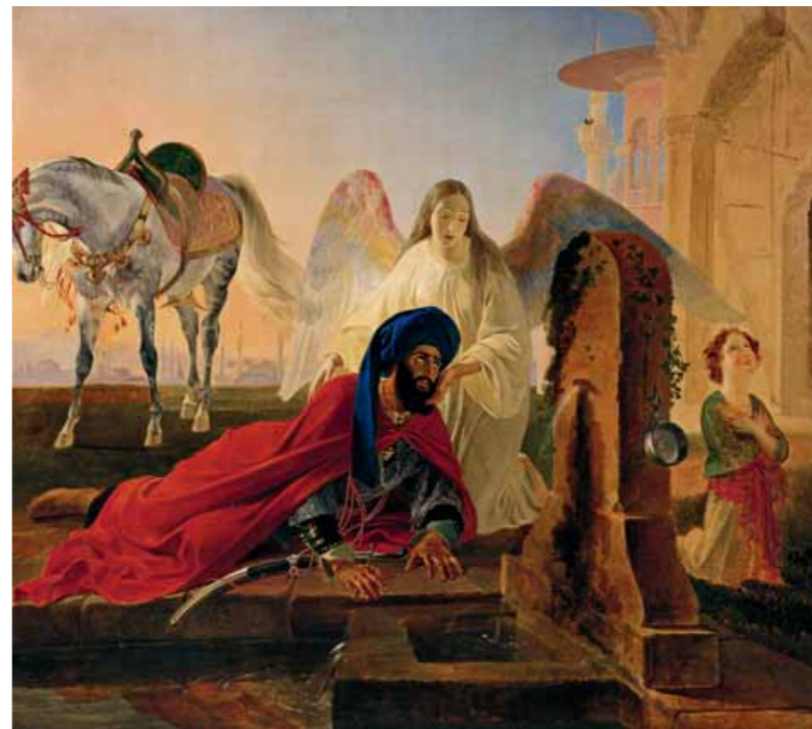
К.П.БРЮЛЛОВ Пери и ангел 1839–1843 Холст, масло 123×141,5 Волгоградский музей изобразительных искусств

Живопись XVIII – первой половины XIX века представлена именами признанных мастеров, но не хрестоматийными, а неожиданными произведениями. «Дети с барашком» Владимира Боровиковского (Рязанский государственный областной художественный музей им. И.П.Пожалостина) – редкий пример группового портрета – жанра в пейзаже, красив по колориту и эмоционально необыкновенно привлекателен исходящим от не-