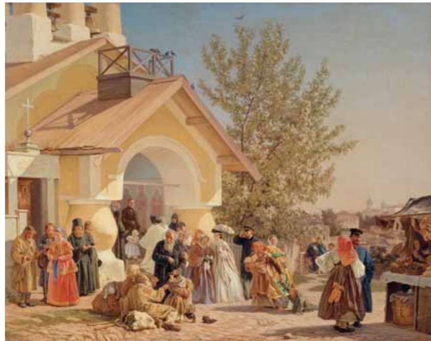
Alexander MOROZOV People Coming Out of Church in Pskov. 1864 Oil on canvas 70 by 89 cm

Tretyakov was the only collector to purchase paintings like Nikolai Ghe's "Peter I Interrogates Tsarevich Alexei Petrovich at Peterhof", Lev Kamenev's "The Mist. The Red Pool in Moscow. Autumn", the portraits of the artists Fyodor Vasilyev and Mikhail Klodt by Kramskoi, Klodt's "Mermaids", as well as all three pieces exhibited by Perov: "Portrait of the Playwright Alexander Ostrovsky", "Hunters at a Halting-place" and "The Fisherman". The landscapes by Shishkin "The Pine Grove", Savrasov "Losiny Ostrov in Sokolniki" and his true masterpiece "Rooks Have Come" were also acquired at that exhibition.