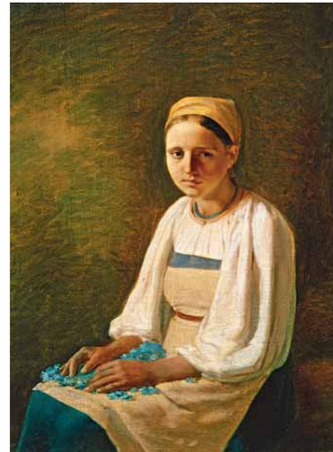
Alexei VENETSIANOV A Peasant Girl with Cornflowers. 1820s Oil on canvas 48.3 by 37.1 cm