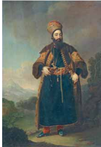
В.Л.БОРОВИКОВСКИЙ Портрет Муртазы-Кули-Хана. 1796 Холст, масло 58,7×41,5