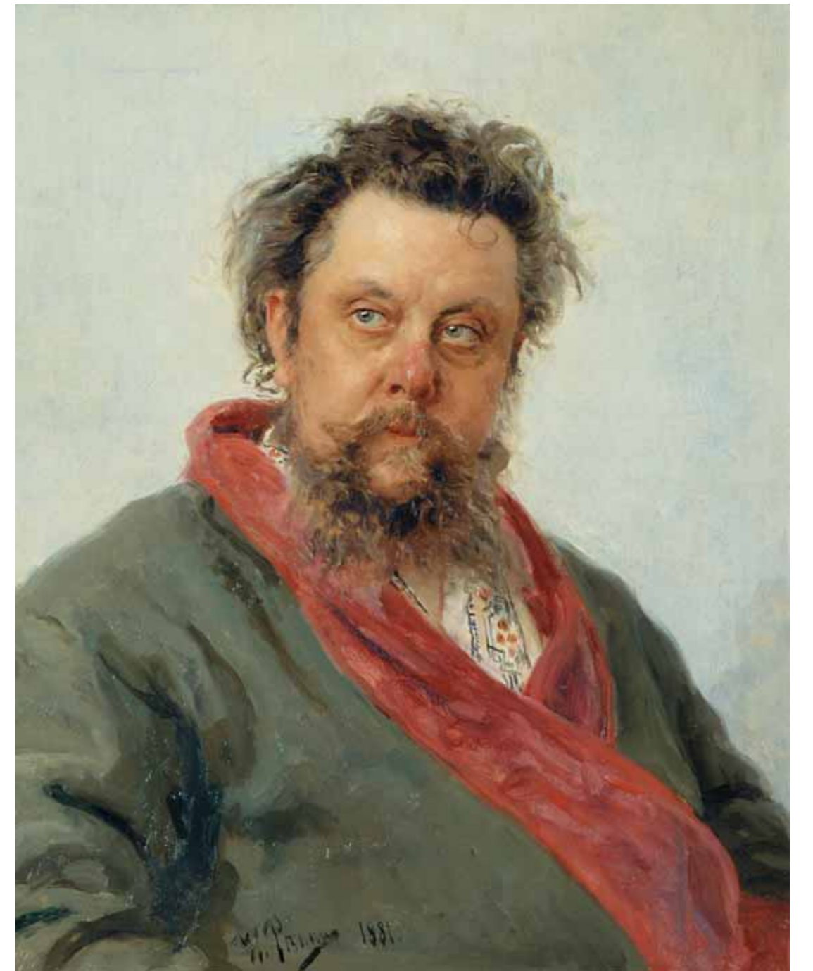
И.Е.РЕПИН Портрет М.П. Мусоргского 1881 Холст, масло. 69х57