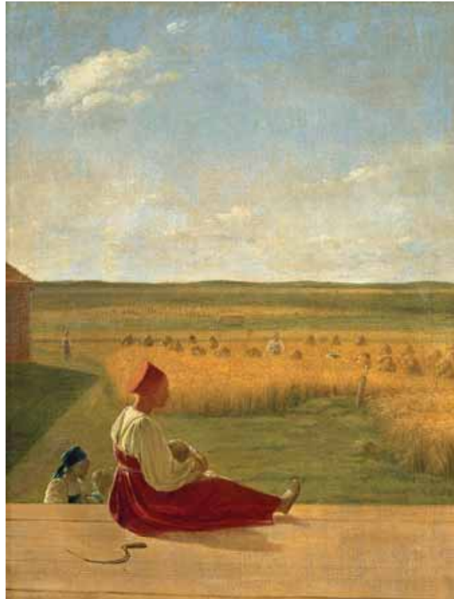
А.Г.ВЕНЕЦИАНОВ На жатве. Лето Середина 1820-х Холст, масло. 60×48,3

Alexei VENETSIANOV Harvesting. Summer Mid-1820s Oil on canvas 60 by 48.3 cm