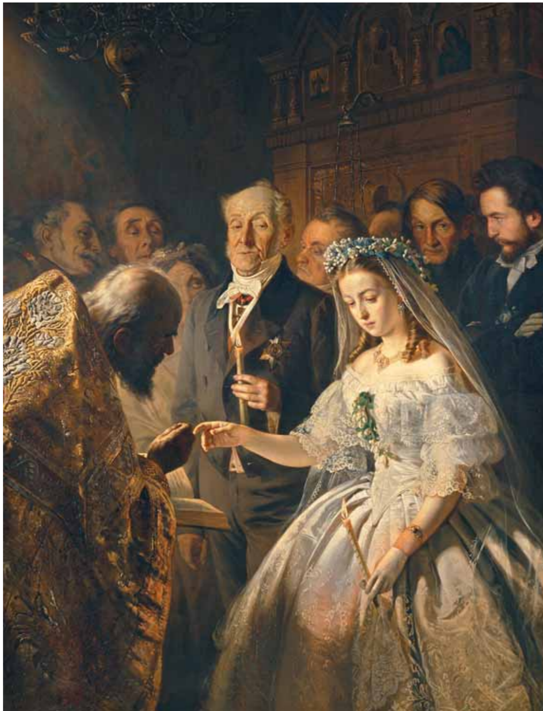
В.В.ПУКИРЕВ Неравный брак . 1862 Холст, масло 173х136,5

Tretyakov did not limit himself to the art of the Wanderers. His collecting interests were much wider, and he could recognize talent in young artists who had just manifested themselves, as well as in new art trends. "I aim at collecting the Russian school as it is, in its consecutive development," wrote Tretyakov to one of his correspondents. He had perfect understanding of the vibrant connection of the past and the present in the development of Russian culture. The art of the early 19th century – the works by Bryullov, the studies by Ivanov, the pieces by Tropinin and Venetianov – and paintings from the 18th century, and later Old Russian art – all gradually appeared in Tretyakov's collection, comprehensively presenting Russian painting in its historical development. It is now difficult to imagine a collection of 18th century paintings without such true masterpieces as "Portrait of M.I. Lopukhina" by Vladimir Borovikovskiy, "Portrait of F.S. Rimsky-Korsakov" by the then little-known Fyodor Rokotov, and the "View of