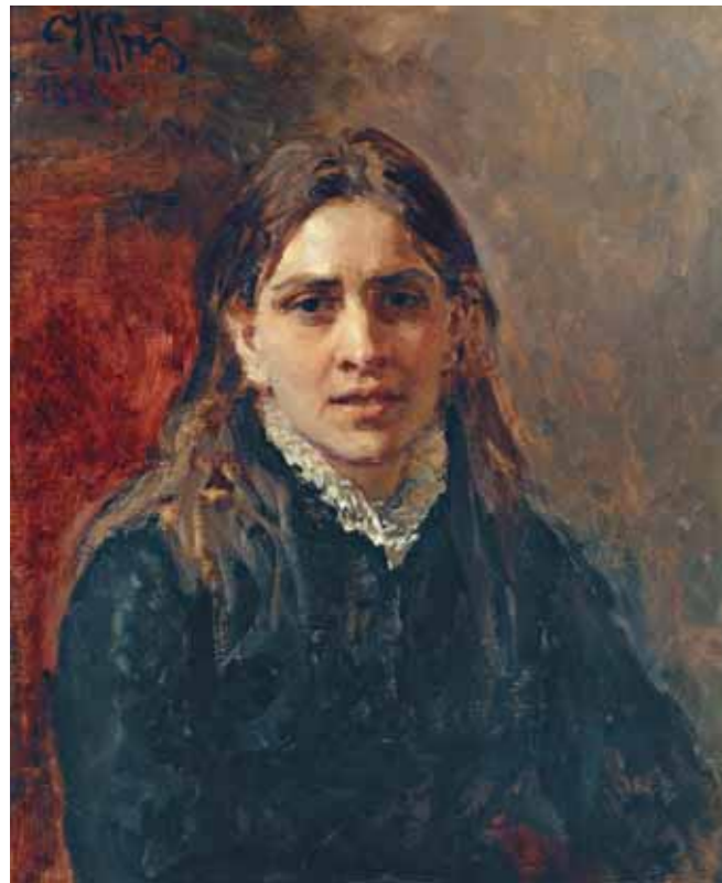
И.Е.РЕПИН Портрет П.А. Стрепетовой. 1882 Этюд Холст, масло. 61×50