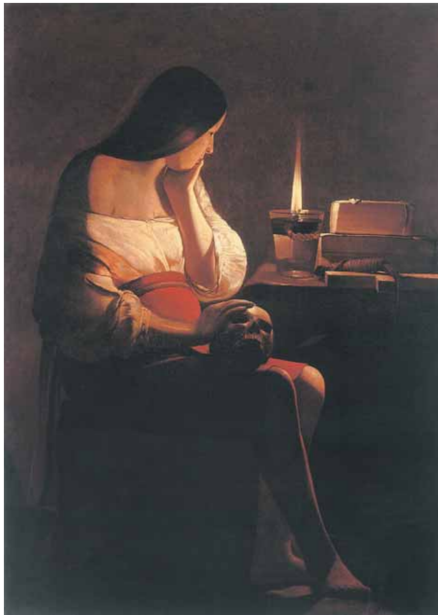
Жорж де ЛА ТУР Магдалина с лампадой Ок. 1640–1645 Холст, масло 128 × 94 Лувр, Париж