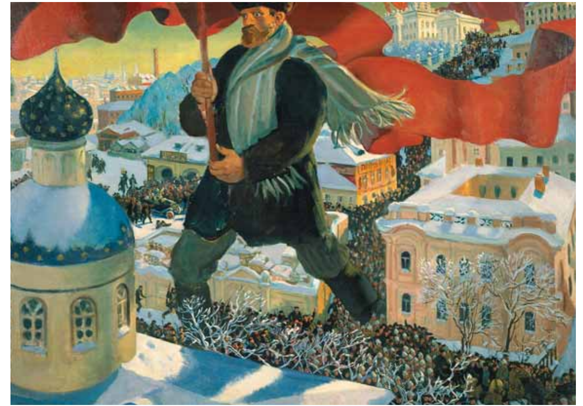
Б.М. КУСТОДИЕВ Болшевик. 1920 Холст, масло 101 x 141 ГТГ

После Парижа экспозиция будет представлена в Берлине с 17 февраля по 7 мая 2006 года.