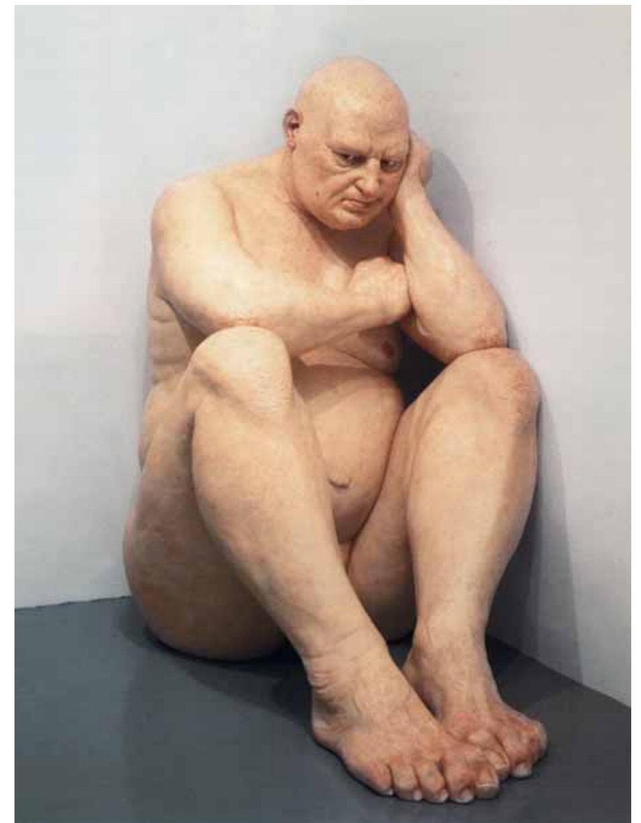
Рон МУК Без названия (Большой человек) 2000

Boris KUSTODIEV The Bolshevik. 1920 Oil on canvas 101 by 141 cm Tretyakov Gallery