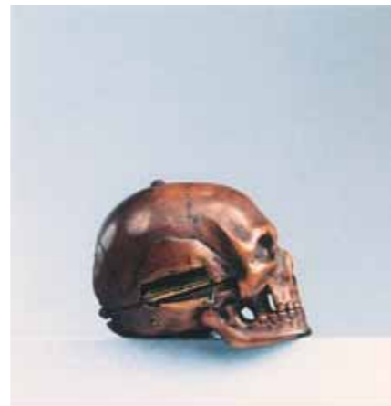
Дени МАРТИНО Часы в форме черепа Ок. 1630 Самшит, латунь, железо 4,4 × 3,2 × 3,8 Национальный музей Ренессанса, Экзон

Although melancholia was not yet associated with any specific iconography, it was in the days of the Greek civilization that funeral steles started to be decorated with brooding figures burying their heads in their hands. Later they would become a model for the most common portrayal of the melancholic. At the end of the 3rd century some Christians of the Middle East would give up their homes and families to settle in the deserts of Egypt and Syria, seeking for conciliation of some special