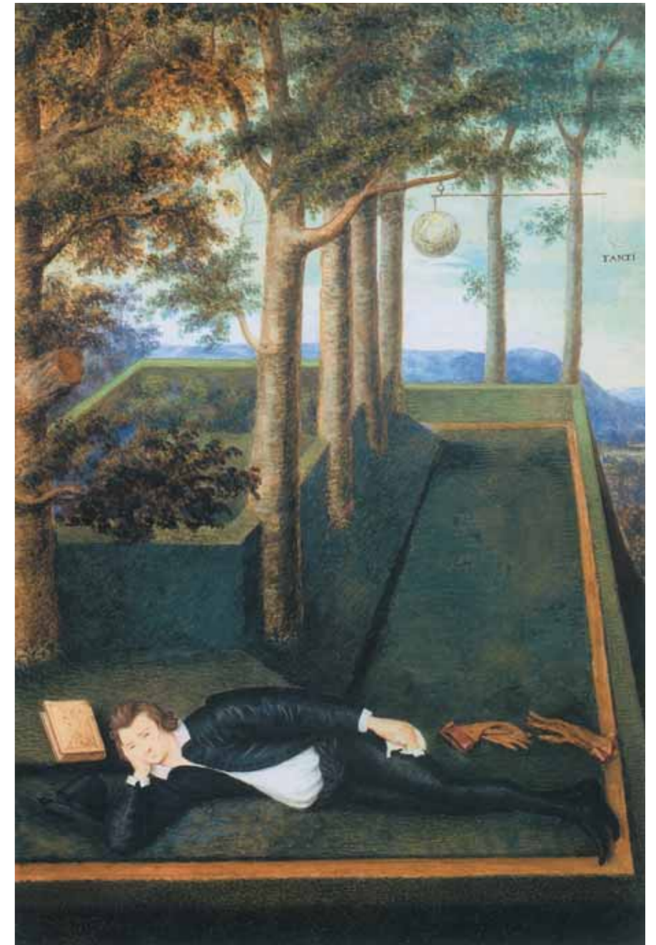
Nicholas HILLIARD Portrait of Henry Percy, 9th Earl of Northumberland C. 1594 Miniature on parchment 25.7 by 17.3 cm Rijksmuseum, Amsterdam

точно передает идею восприятия темы меланхолии в изобразительном искусстве того времени. Меланхолия объявлена серьезной болезнью. Больных отправляют в специальные приюты и лечебницы, изучают, пытаются избавиться от недуга и изолируют от общества.