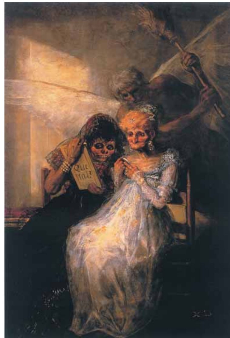
Франсиско ГОЙЯ Время, или Старуха Ок. 1808–1812 Холст, масло. 181 × 125 Дворец изящных искусств, Лилль

Romanticism, the partial partner of Enlightenment, displayed more zest for life and in time created a distinct image in literature, music and art, as illustrated in the exhibition's sixth part. Moreover, the evident decline of faith in the West heralded by Nietzsche in his statement that "God is