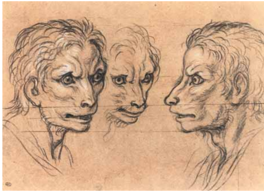
Шарль ЛЕ БРЕН Три мужские головы похожие на волчьих Тонированная бумага, уголь, белила 20,5 × 28,5 Лувр, Париж