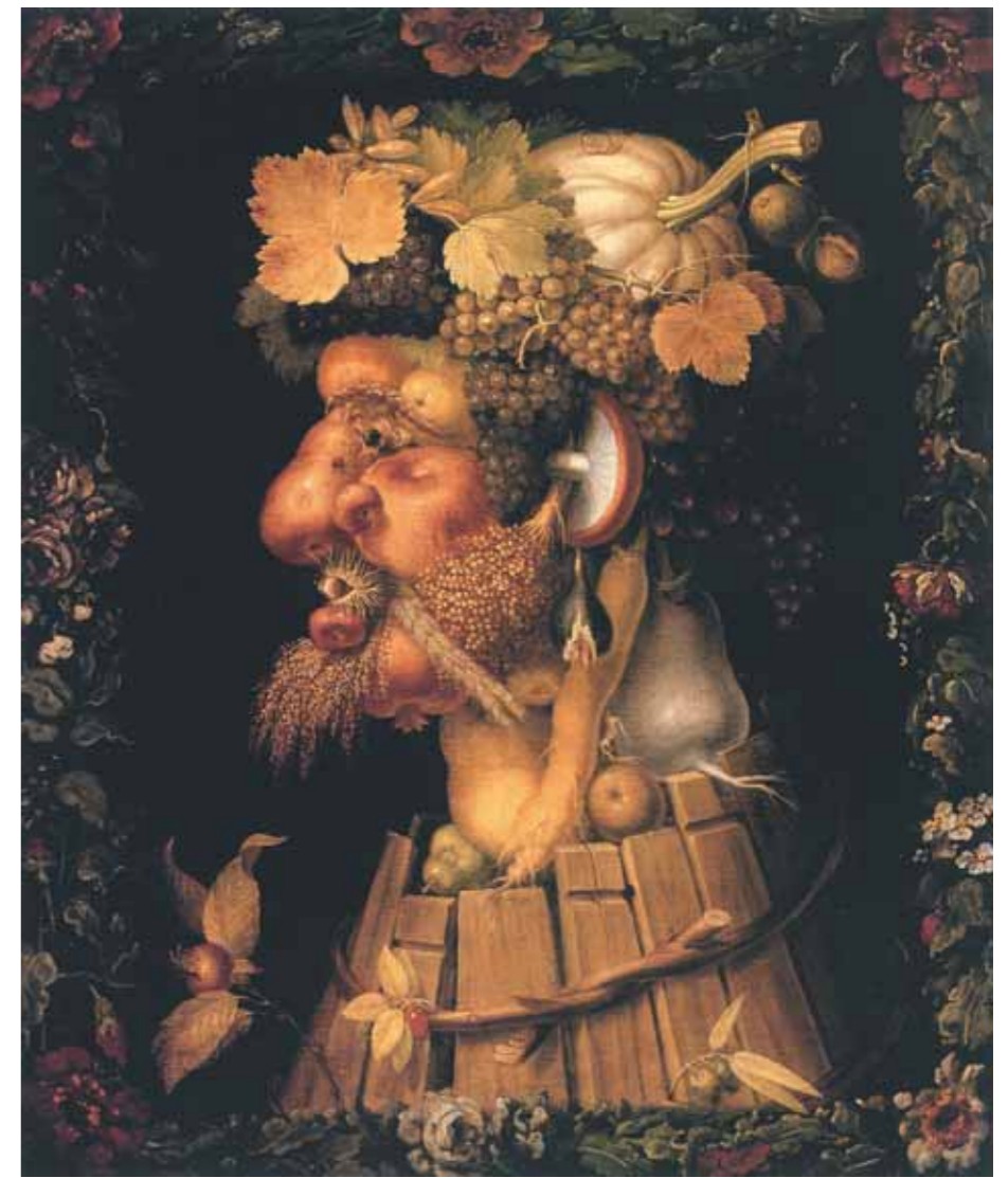
Giuseppe ARCIMBOLDO The Autumn . 1573 Oil on canvas 76 by 63.5 cm Louvre, Paris

представляя природу как новую Пустыню, населенную воображаемыми, фантазмагорическими существами или демонами.