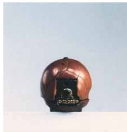
Denis MARTINOT Watch in the form of a skull. C. 1630 Box-tree wood, brass and iron 4.4 by 3.2 by 3.8 cm Musée national de la Renaissance. Ecouen