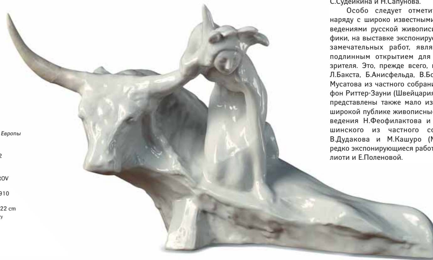
В.А. СЕРОВ Похищение Европы 1910 Бисквит 28 × 45 × 22 ГТГ

Важно сказать, что наша экспозиция не есть реконструкция знаменитой московской выставки 1907 года, а является концепцией «Голубой розы» как художественного движения в русском искусстве начала XX столетия, и дается оно в динамике, эволюции. Развитие идет от произведений, рождающих эмоции «сказок и снов», исполненных блеклыми, «сонными» красками, погружающих зрителя в сон, тишину, мечту. Затем – через образы, рождающие чувства гармонии и радости бытия, – к драматизму и экспрессии в работах на тему Жизни–Балагана. Схематизируя и обобщая, можно сказать, что это путь от «Рождений» и «Голубого фонтана» П.Кузнецова до