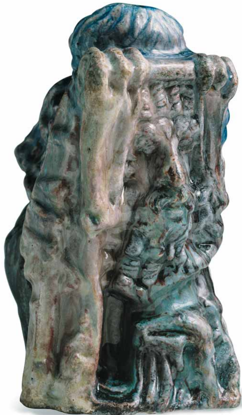
М.А. ВРУБЕЛЬ Ассириец Майолика 19,7 × 11,5 × 13,3 ГТГ