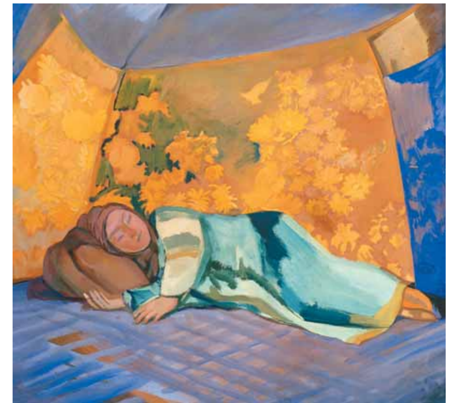
Nikolai SAPUNOV Colombina. 1910–1911 Tempera on canvas 72 by 65 cm Tretyakov Gallery

of intellectual labour with an aim of creating a single artistic image for the era: in Russia this grand art style was called Moderne. In Russia such developments were manifested, as well as in other ways, in the creation of a type of private mansion which coincided with the active growth of the Russian bourgeoisie. The organizers of the exhibition wanted to give viewers some idea of the Russian