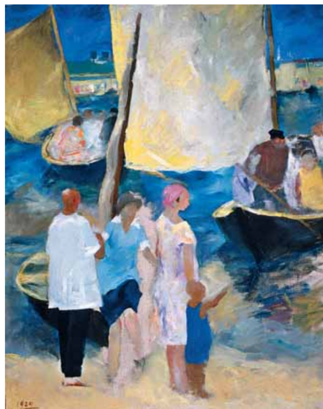
Sailing. 1929 Oil on canvas 103 by 80 cm