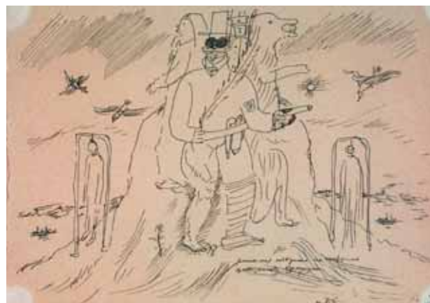
Композиция на тему «Революция». Никакая поддержка недопустима правительству буржуазии. Середина 1920-х. Бумага, тушь, перо. 13×18,3

The SMCA had intended to group numerous sketches connected with one of Nikritin's few finished large paintings, "The Old and the New", around the main