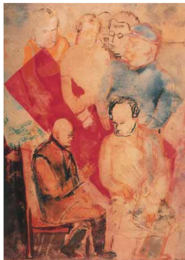
Argument 1930 Tempera, water- colour on paper 30,3 by 21,7 cm

invalids and other elements. Nikritin's works represent the atrocities of both the First World War and the Russian Civil War. The motif of classical art can also be seen in all of his artwork; Nikritin tried to figure out the formula of beauty and ultimate mastery and grasp it in all possible ways by creating replicas of various famous artists' works, as well as drawing well-known sculptures, which took him years to complete.