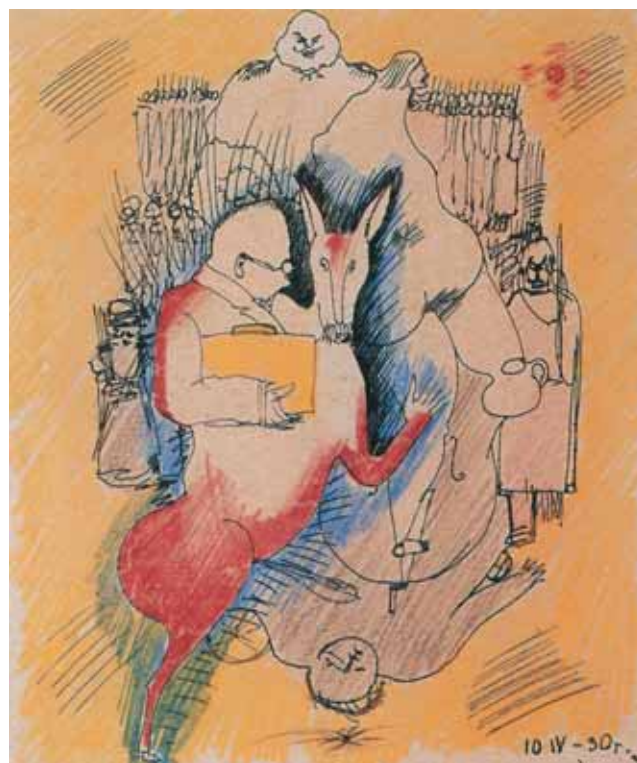
From the "Monument" series. 1930. Srayon, ink on paper. 17,4 by 14,6 cm

реходят в изобразительные формы. Именно этот процесс стремились отразить в своей экспозиции организаторы выставки.