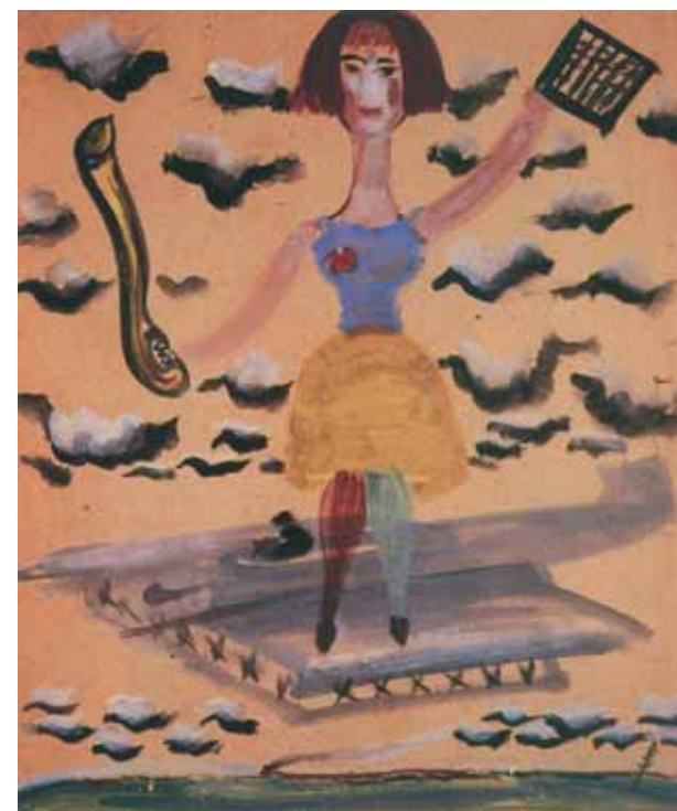
Journey around the World. Mid-1920s Oil on plywood 47.7 by 59.7 cm

in-chief and coordinator of the publication. The catalogue includes several articles analyzing different aspects of Nikritin's art, texts written by the painter himself, alongside memoirs by Vladimir Kostin and Isa Berdichevski, who knew the artist personally, and other materials. The entire contents of the catalogue form the main idea behind the exhibition – a multi-faceted analysis of Nikritin's extensive artistic legacy. The same principle served as the background for the exhibition: it was based on the main artistic themes that unite material that is sometimes very similar, but often very different.