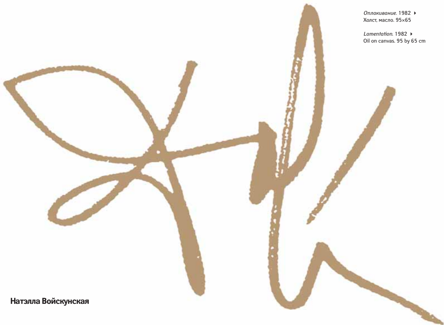
Lamentation. 1982 ▶ Oil on canvas. 95 by 65 cm