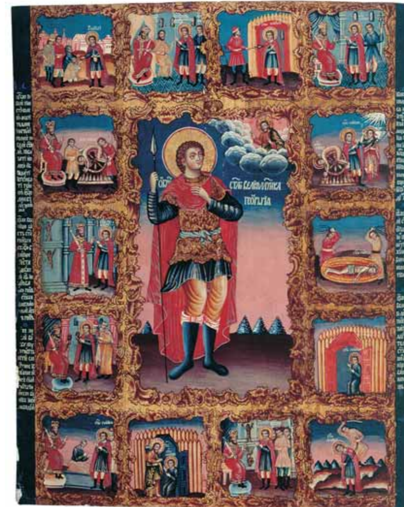
ST. GEORGE WITH SCENES FROM HIS LIFE End of the 18th century Wood (three panels), gesso ground, tempera 126,3 × 102,5 cm

The exhibits of the archeological museum tell the history of the land called Cherepovets; in the nature museum one can see the zoological, botanical, geological and paleontology collections. Thanks to annual specialized expeditions, the museum's collections are being constantly replenished.