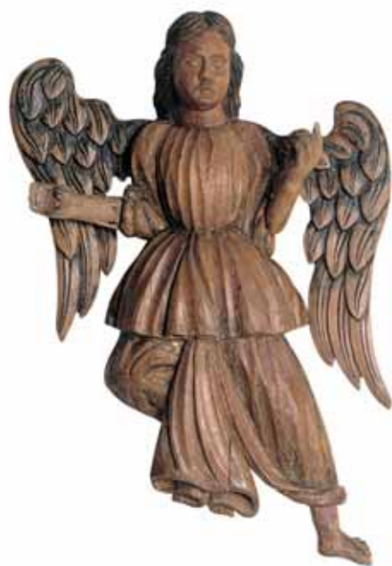
АНГЕЛ XVIII век Дерево, левкас, темпера 62 × 41 × 14,5