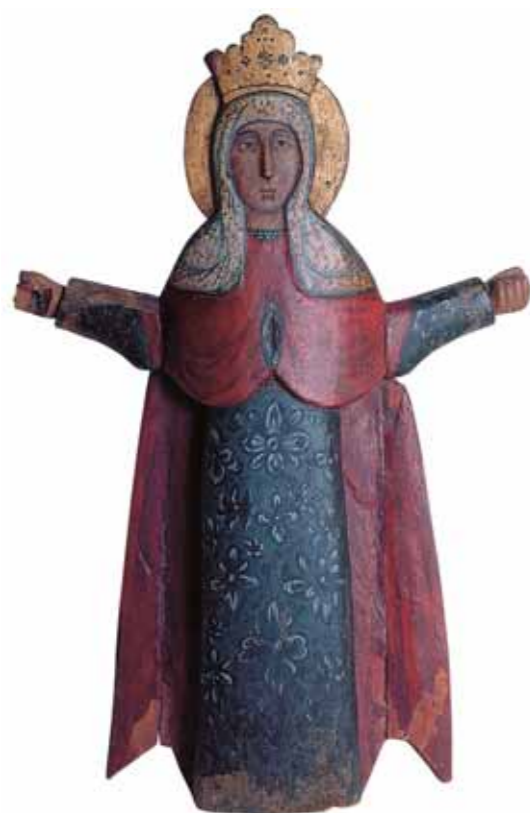
СВЯТАЯ ВЕЛИКОМУЧЕНИЦА ПАРАСКЕВА ПЯТНИЦА XVIII век Дерево, левкас, темпера 91 × 63 × 11