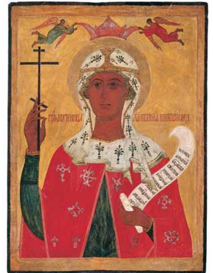
СВЯТАЯ МУЧЕНИЦА ПЯТНИЦА XVI век Дерево, левкас, темпера 85 × 63

The historical department of the Cherepovets museum reveals the history of the Vologda region and the town of Cherepovets. Thanks to the support of the "Open Society" institute, the exhibition "Hero of Our Time: The 20th century" has opened. The art department is devoted to the art and culture of the Vologda region from the 11th–early 20th centuries, and exhibits relics of Orthodox culture. The two sections occupy a building constructed in the early 20th century in the then-fashionable "red brick style".