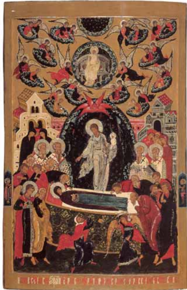
УСПЕНИЕ БОГОМАТЕРИ 1660 Дерево, левкас, темпера 107 × 69