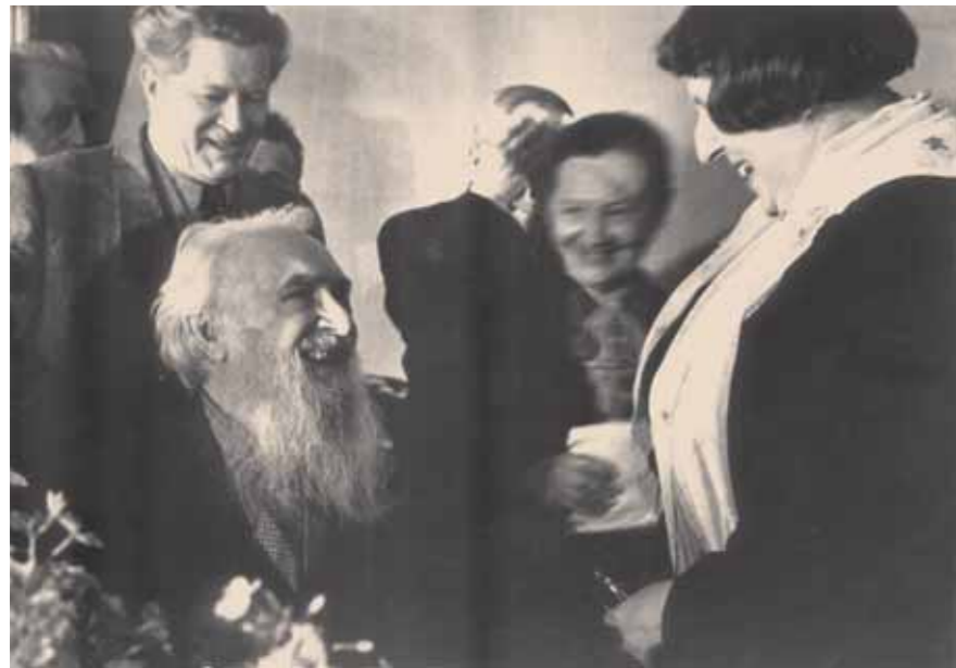
На первом плане С.Т. Коненков и Е.Ф. Белашова. Фото 1960-х гг.