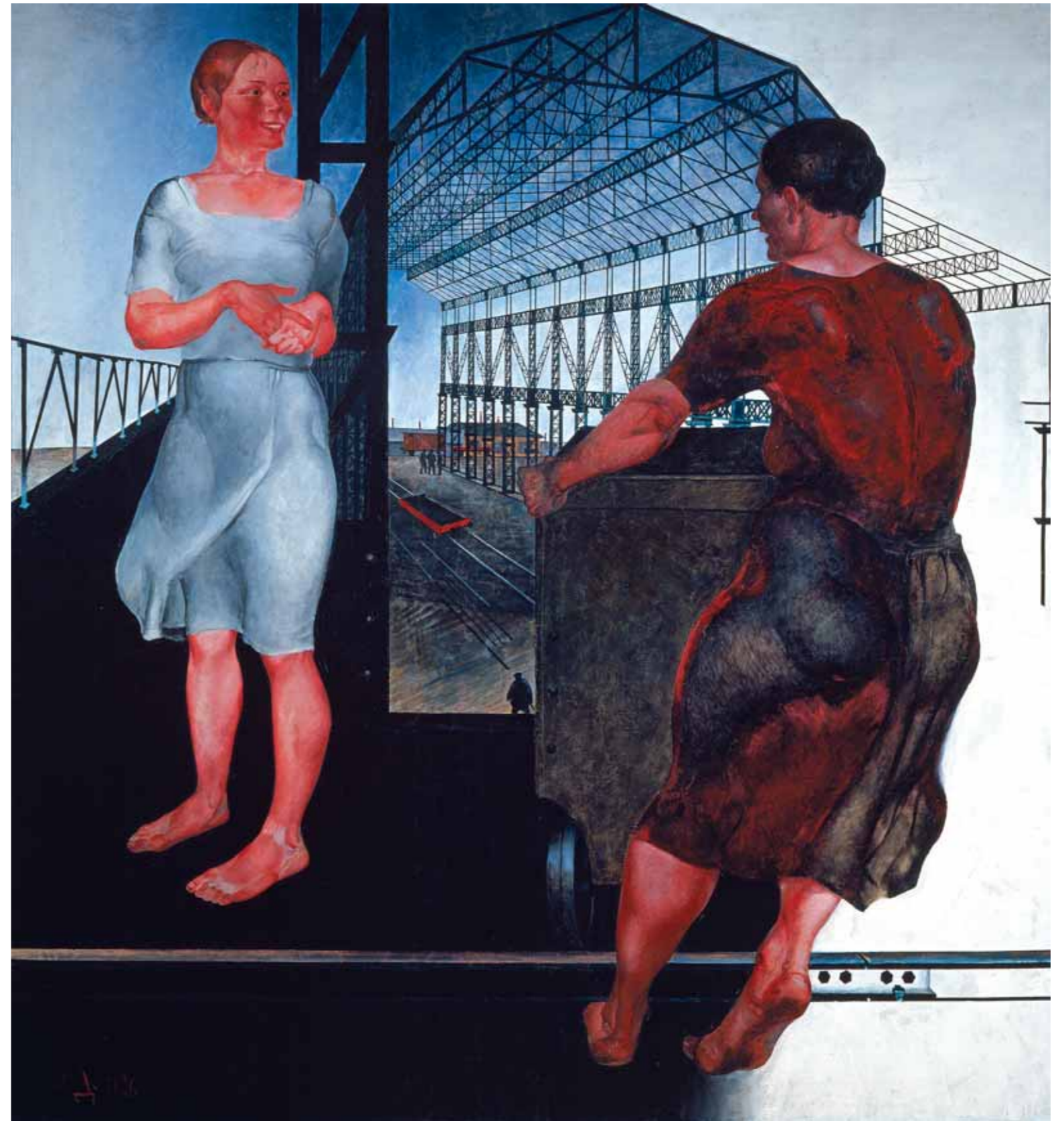
А.А.ДЕЙНЕКА На стройке новых цехов. 1926 Холст, масло. 209×200

However, plans for moving the gallery did not materialize. Construction dragged on, and it was not until the late 1970s that the Central House of Artists