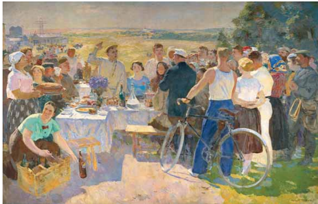
С.В. ГЕРАСИМОВ Колхозный праздник. 1937 Холст, масло